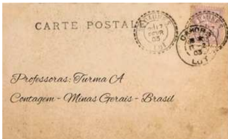
Figura 3 - Padlet Como e por que você se tornou professora?

Fonte: AVA do Curso Leitura e Escrita na Educação Infantil 2020 https://youtu.be/NJHBsZIsYoU - Vídeo produzido pela tutora da Turma com fragmentos das Cartas das cursistas.