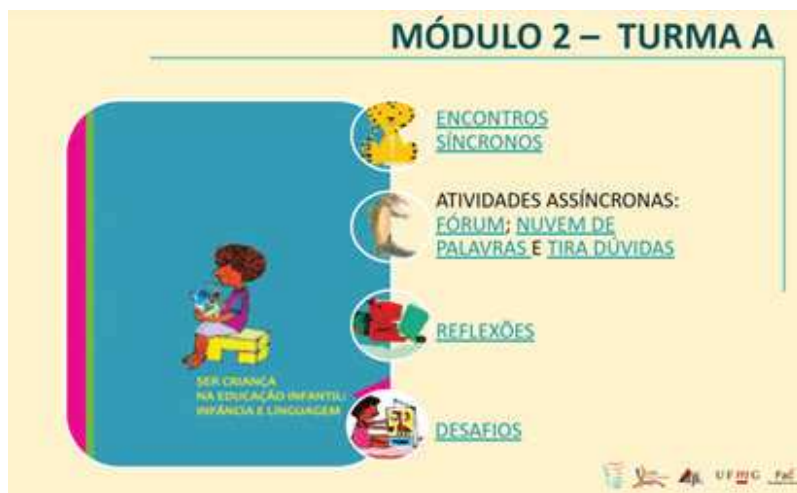
Figura 2 - Página do portfólio com roteiro do registro dos encontros síncronos de estudo dos módulos