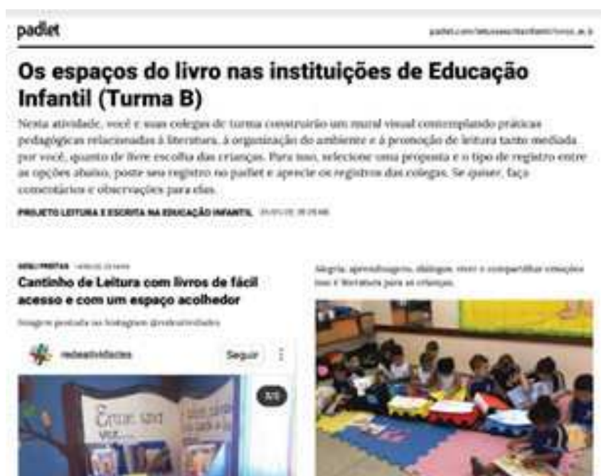
Figura 4 - Padlet Os espaços do livro nas instituições de Educação Infantil