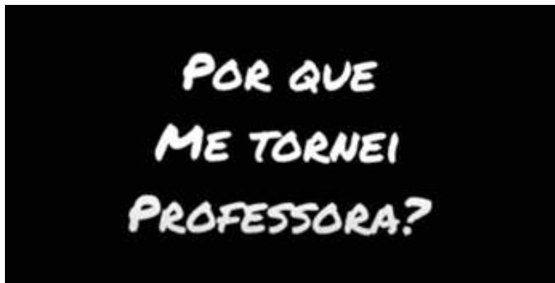
Figura 4 - Padlet Como e por que você se tornou professora?