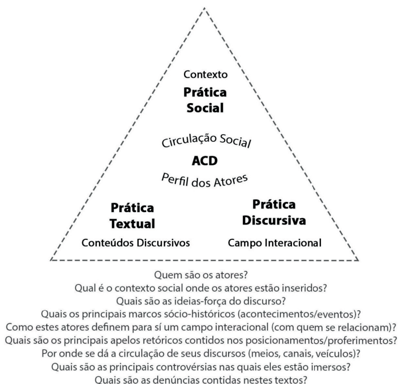
Figura 2 – Dimensões analíticas do discurso