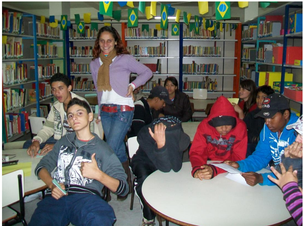
Imagem 3 – 2º Encontro com o Grupo Focal – 31/07/11