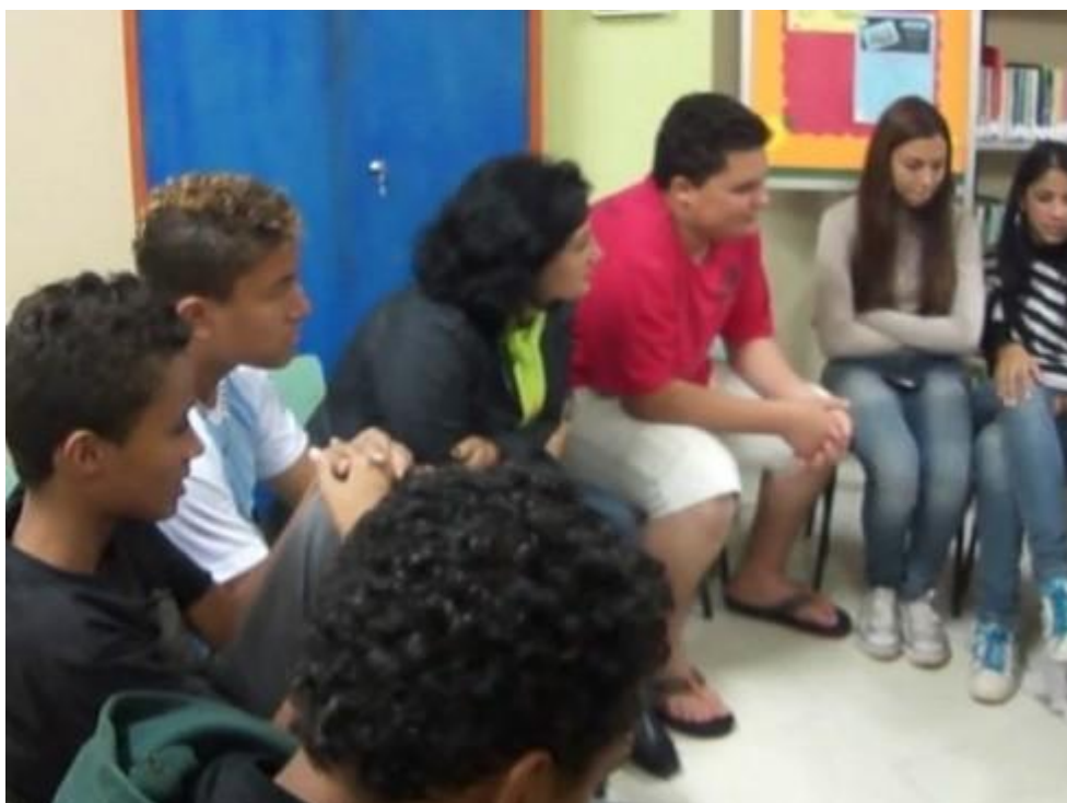
Imagem 1- 1º Encontro com o Grupo Focal – 15/07/12