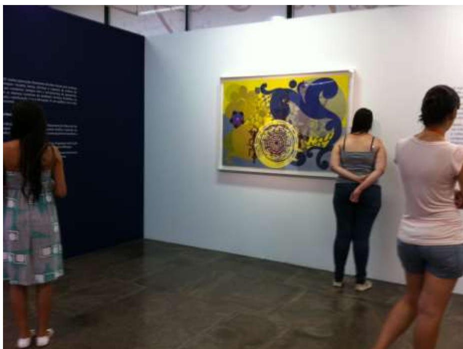
Foto 07: Em busca de novas experiências estéticas: visita ao Museu de Arte Murilo Mendes-JF.

Tais questionamentos não foram esgotados, tampouco resolvidos, muitos deles permanecem ecoando em minhas reflexões, e são exatamente elas que compartilho neste trabalho na expectativa de ampliar as vozes, as escutas, as reflexões e os debates para um universo maior de pessoas que trabalham com ensino de arte.