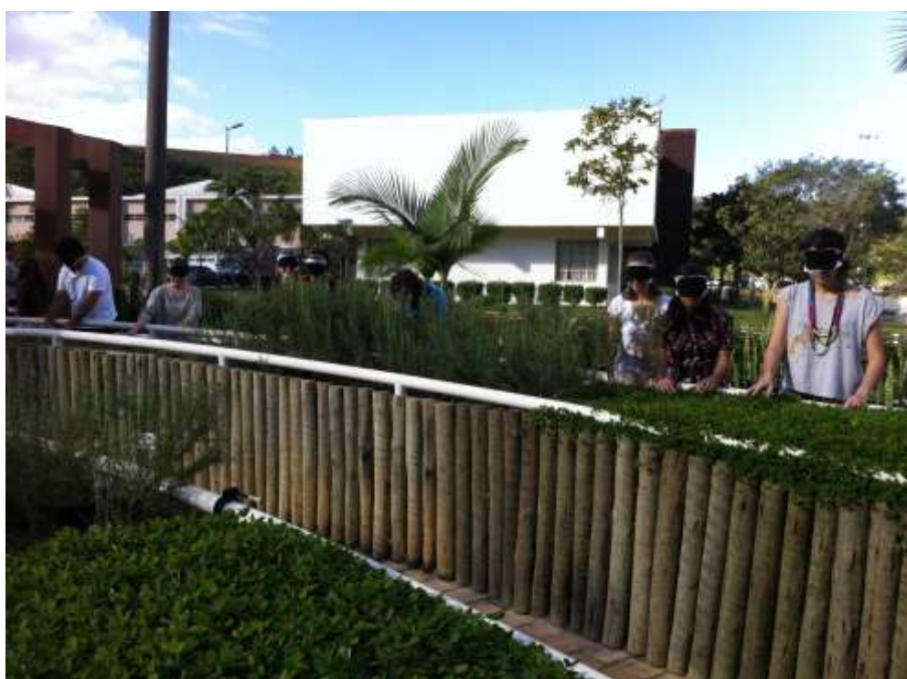
Foto 02: Em busca de novas experiências estéticas: visitando o jardim sensorial com os alunos da licenciatura em artes.