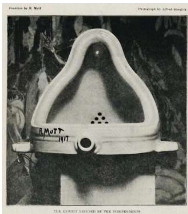
Foto 05: Imagem digitalizada da fotografia de Alfred Stieglitz: “A fonte” (1917) de Marcel Duchamp.

Assim, com este recorte em especial, retomamos a reflexão: no âmbito da formação, os alunos das licenciaturas em arte se reconhecem artistas? Como futuros professores? Como pesquisadores? Como artistas-pesquisadores-professores? A graduação contribui e/ou pretende contribuir para a formação de artistas-pesquisadores-professores? É possível formar um professor de artes independente da sua formação como artista? O que é preciso ser/fazer/saber para integrar o grupo dos artistas-pesquisadores-professores? Essencialmente, o que tem a ver e qual diferença em ser artista-pesquisador-professor?