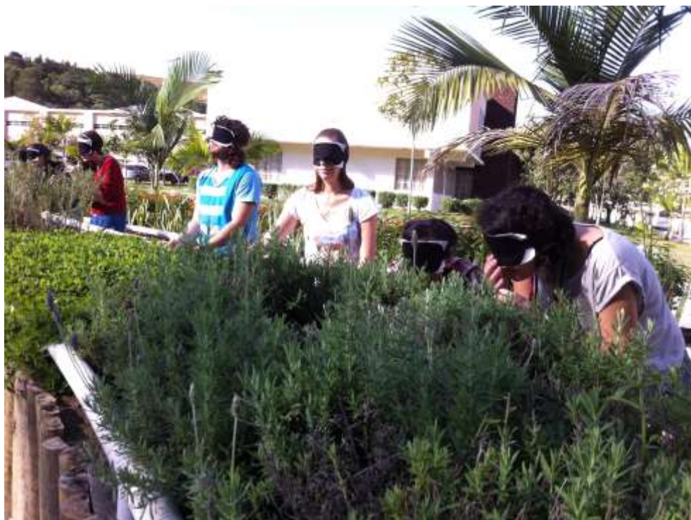
Foto 01: Em busca de novas experiências estéticas: visitando o jardim sensorial com os alunos da licenciatura em artes.