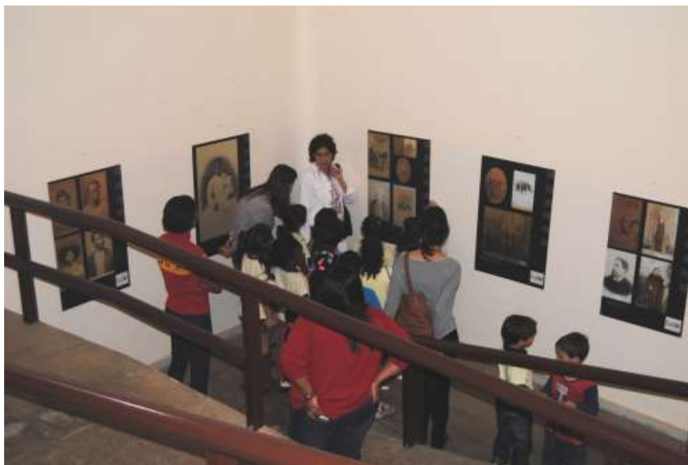
Foto 03: Em busca de novas experiências estéticas: organização e montagem de uma exposição na faculdade e mediando visitas com crianças do ensino fundamental.