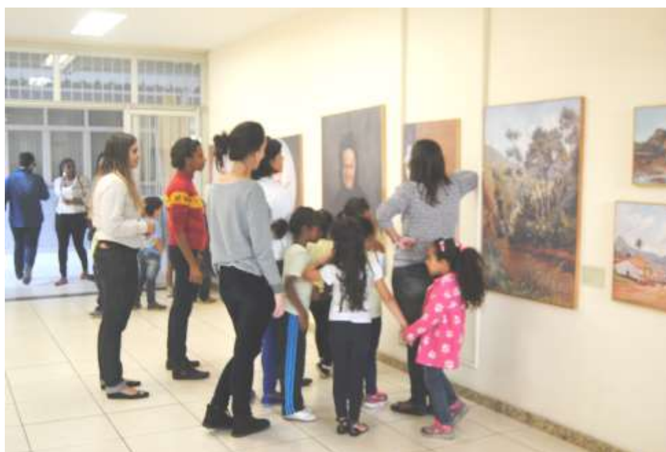
Foto 04: Em busca de novas experiências estéticas: organização e montagem de uma exposição na faculdade e mediando visitas com crianças do ensino fundamental.