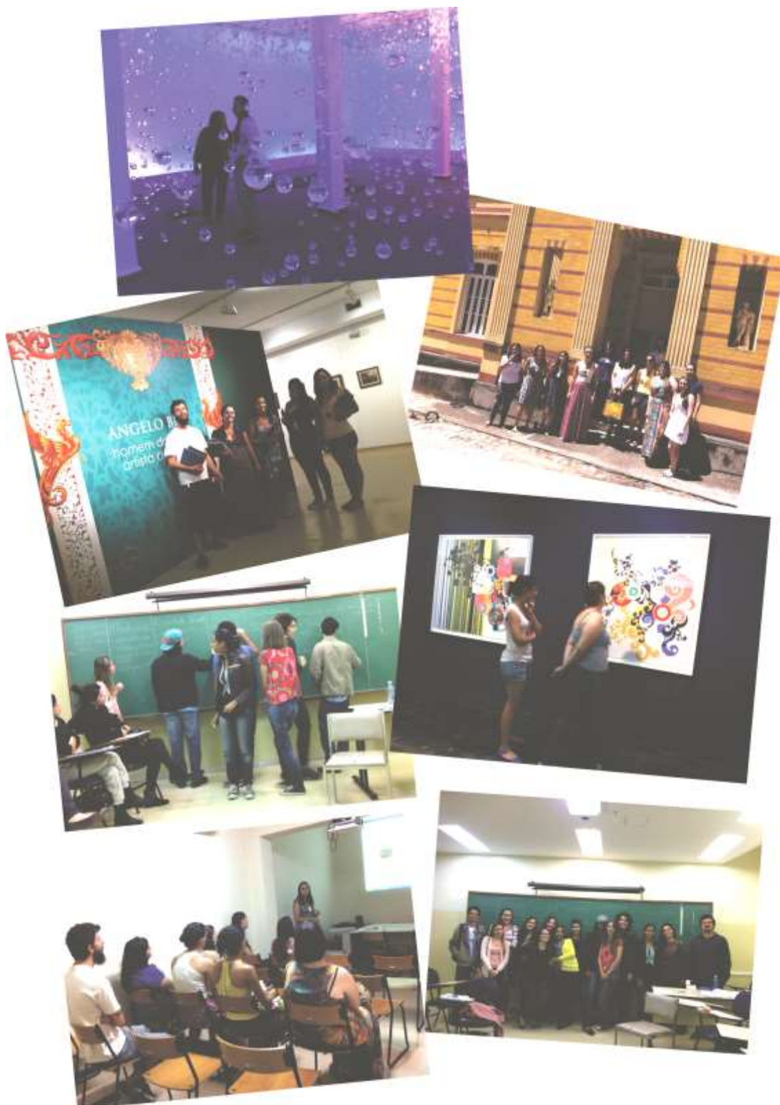
Em busca de novas e múltiplas experiências estéticas: visitas, dinâmicas, palestras, reflexões e vivências artísticas e pedagógicas. Acervo da autora.