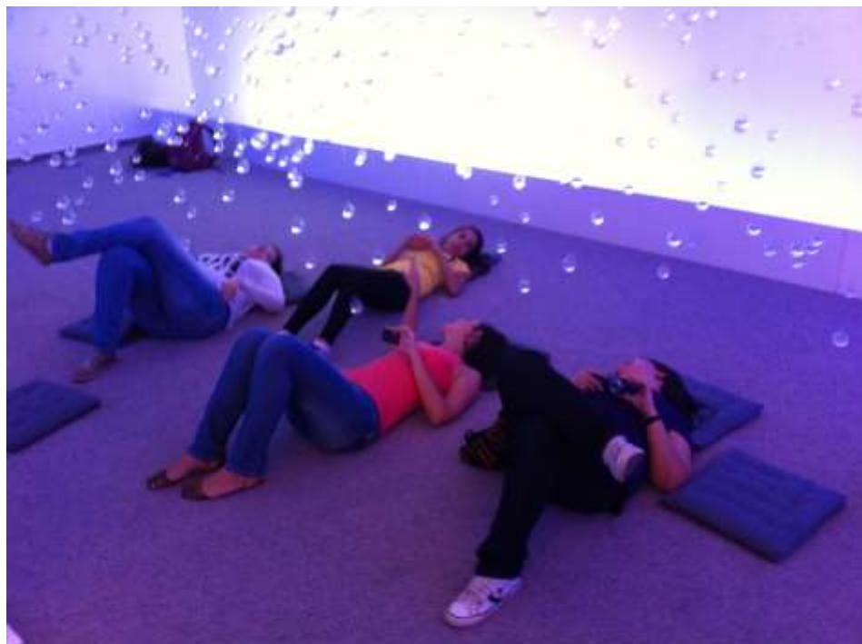
Foto 06: Em busca de novas experiências estéticas: visita a exposição “Lgrimas de São Pedro” no Centro Cultural dos Correios - JF.