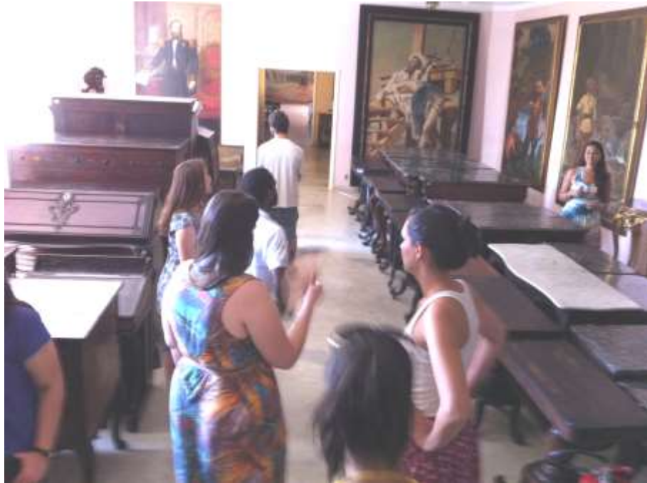
Foto 05: Em busca de novas experiências estéticas: visita técnica ao Museu Mariano Procópio – Juiz de Fora.