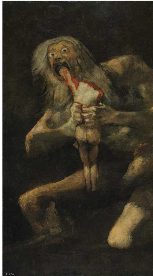
Figura 4 – Francisco de Goya, Saturno devorando a su hijo (1819-1823)

Fonte: < https://bit.ly/2lyMMKL >. Acesso em: 7 dez. 2018.