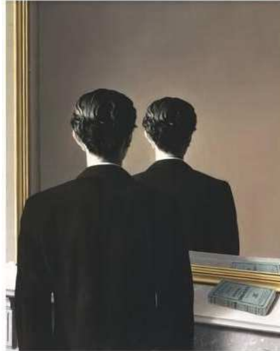
Figura 2 – René Magritte, La réproduction interdite (1937)