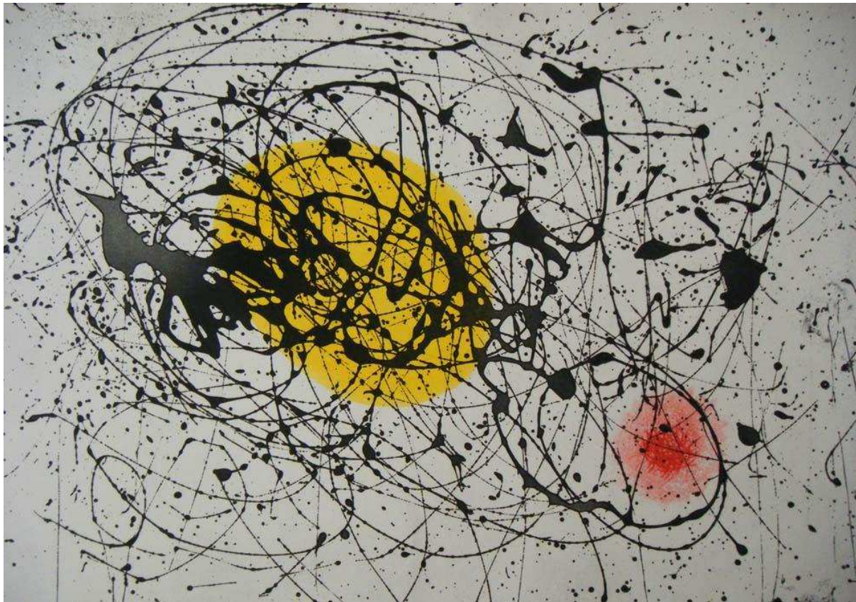
Figura 8 – Joan Miró, Yellow Moon Bird (1963)