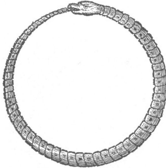
Figura 3 - Oroboro