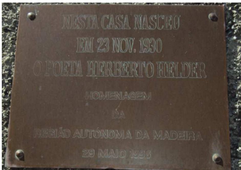
Figura 7 – Placa afixada no muro da casa de nascimento de Herberto Helder, na Ilha da Madeira

Fonte: < https://bit.ly/2STXonE >. Acesso em: 30 dez. 2018.