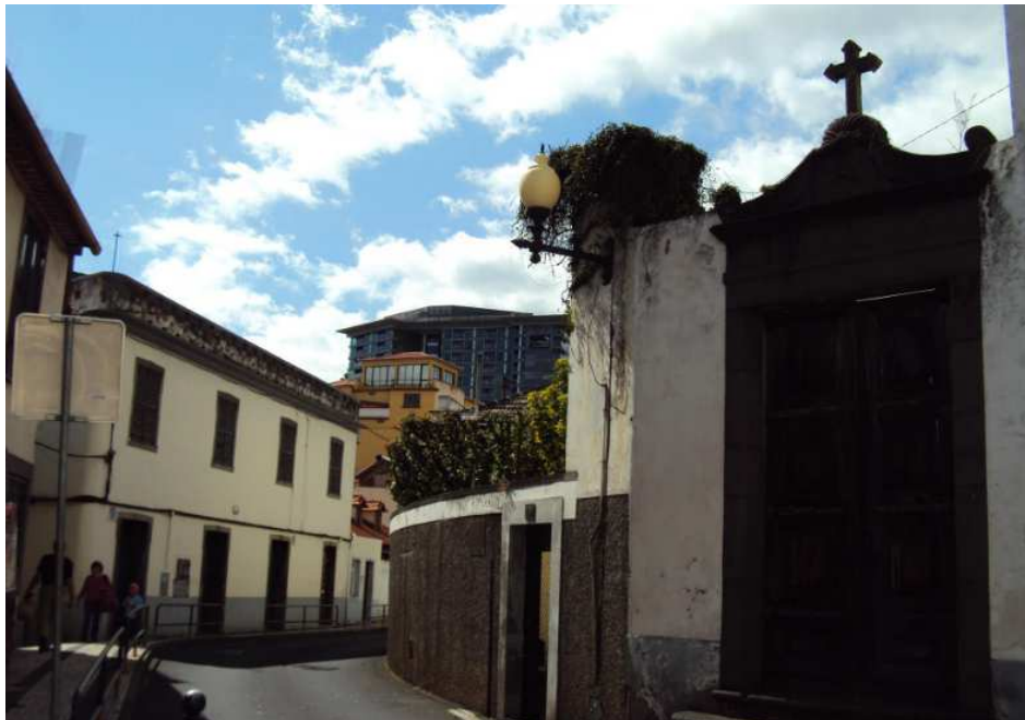
Figura 5 – Casa de nascimento de Herberto Helder, na Ilha da Madeira