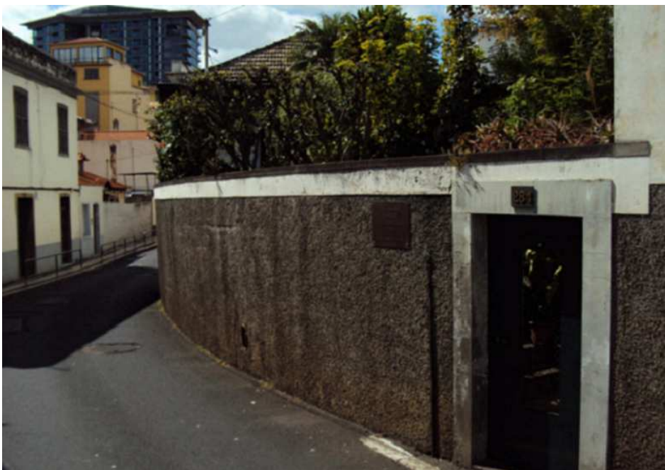
Figura 6 – Casa de nascimento de Herberto Helder, na Ilha da Madeira