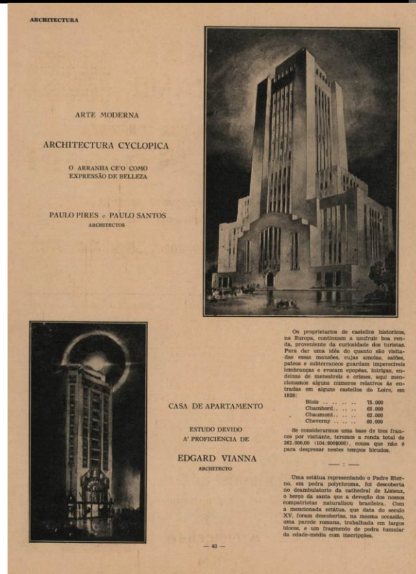
Figura 3. Paulo Pires e Paulo Santos. Arquitetura Cicolópica (alto). Abaixo, Edgard Vianna. Casa de apartamentos. Ilustrações publicadas na revista Arquitetura , junho de 1929.