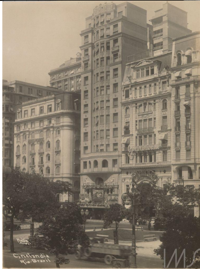
Figura 2. Augusto Malta. Cinelândia. Os cinemas Pathé, Palace e Capitólio.