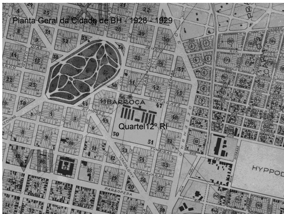
Figura 4: Arquivo Público da Cidade de Belo Horizonte: Planta Geral de Belo Horizonte 1928-1930, em destaque o Quartel do 12º e o local onde terminava a Av. Amazonas e se localizava a Barroca, representado no mapa pelo espaço cheio de vias tortas.

O Brasil nos anos trinta é marcado por grandes transformações que repercutiram nos planos econômico, social e político. E essas mudanças chegaram à cidade de Belo Horizonte e provocaram alterações no projeto urbanístico concebido para os seus espaços. Desse modo, os bairros que compõem a região do entorno do quartel do 12º Regimento de Infantaria, parte integrante da história da cidade de Belo Horizonte, foram afetados pelo processo de mudança em curso no país como um todo. Essas alterações foram desencadeadas com o fim do confronto entre as forças estaduais e federais, provocando uma enorme destruição na região. Ressaltamos que algumas mudanças já estavam em curso desde os anos 20, com a implantação de indústrias e de novas áreas residenciais.