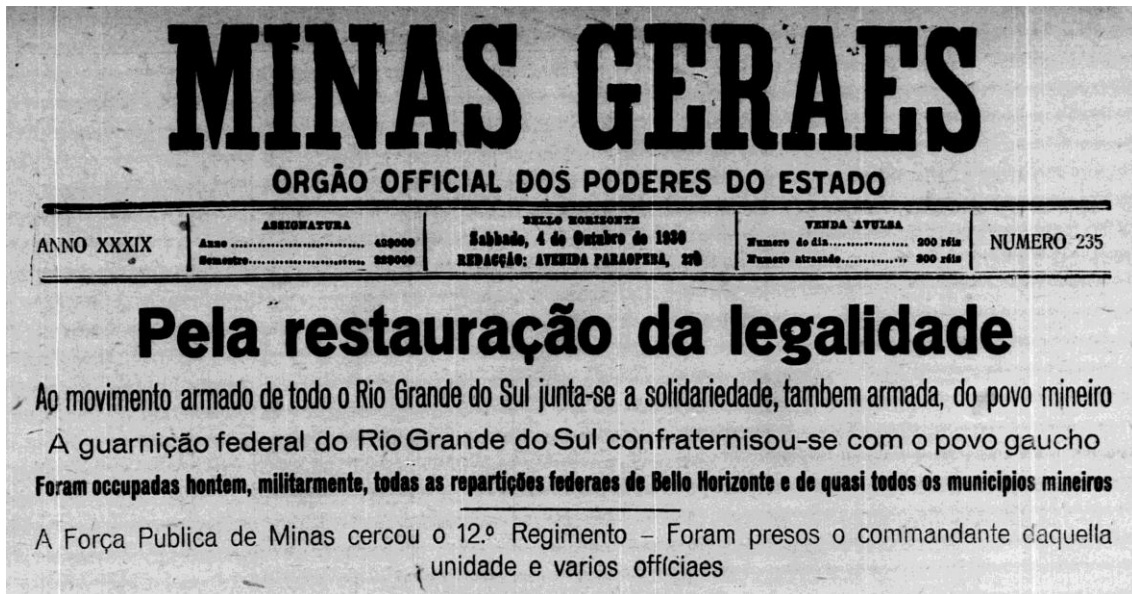
Figura 1: Primeira página do jornal oficial do Governo do Estado de Minas Gerais, noticiando o início do movimento revolucionário.