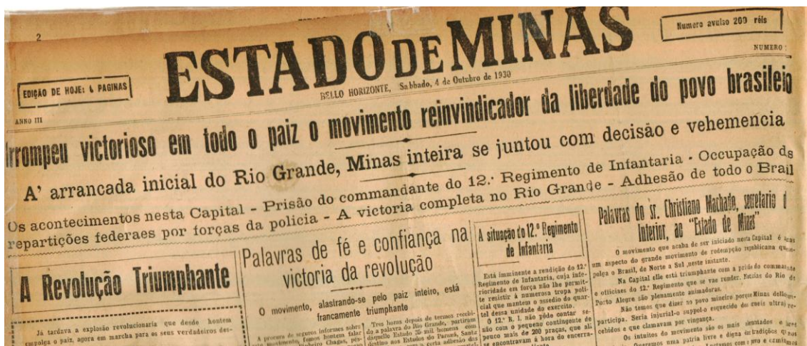
Figura 2: Chamada da primeira página do jornal Estado de Minas, de 4 de outubro de 1930, enfoca como matéria principal o início da revolução.

As unidades militares em Minas Gerais, sediadas em Belo Horizonte, à exceção do 12º RI, elemento central de nosso trabalho, de modo geral não ofereceram grande resistência no enfrentamento com a Força Pública do Estado. A tática adotada pelo governo estadual foi de aprisionamento dos oficiais de comando dessas unidades, momentos antes do início de qualquer enfrentamento das forças. As repartições públicas federais como Correios, Telégrafos, Delegacia Fiscal, estações da Central, da Oeste e a 6ª Divisão Provisória da Central do Brasil, Alfândega e todas as repartições públicas federais ficaram sob a guarda e a responsabilidade das forças mineiras.