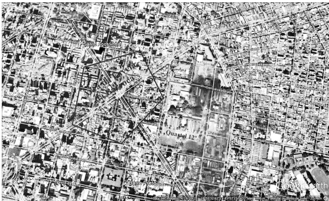
Figura 5: O mapa mostra as alterações da região do Quartel do 12º RI, da antiga favela do Bairro Barroca, e registra a abertura da continuação da Av. Amazonas.