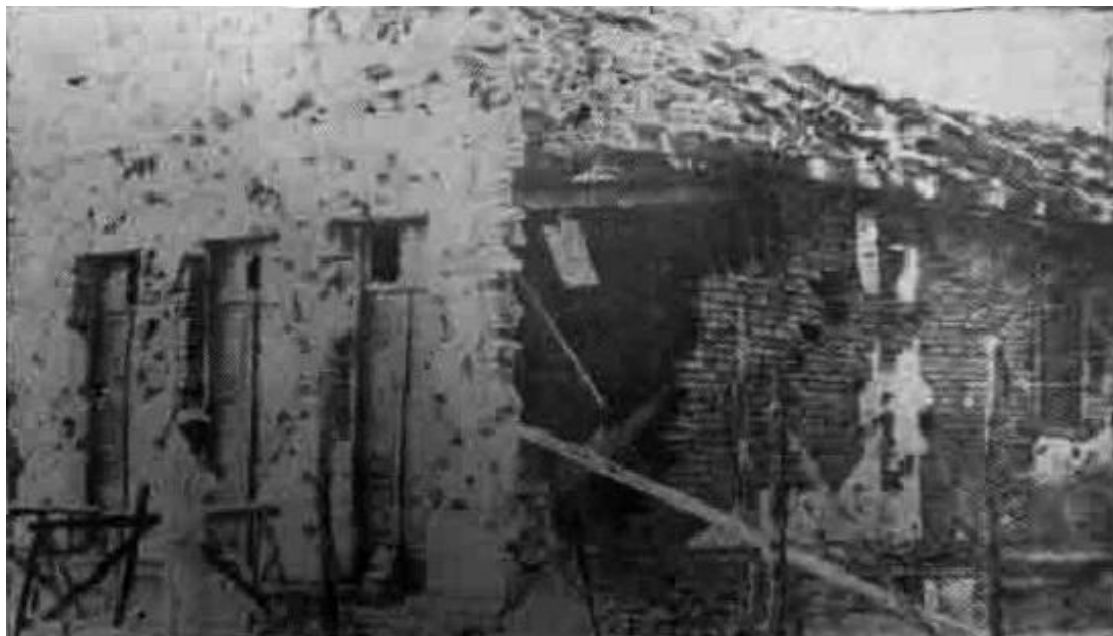
Figura 7: O Botequim do Nagib, na frente do flanco direito do Quartel. No começo, abrigo do atacante, depois neutro e mais tarde da defesa.

pelos tiros desferidos em direção estabelecimento comercial do Nagib. Considerando que o flanco direito do quartel se caracteriza pela elevação em relação as construções próximas ao quartel, reforçam a matéria acima relatada pelo jornal Estado de Minas com o título de “DELENDIA NAGIB”.