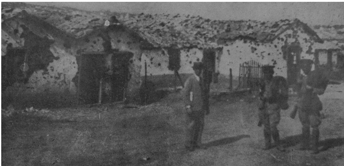
Figura 6: Linhas de cafuas. Até essa linha alcançaram, no primeiro dia, três progressões da vanguarda da Força Pública do Estado.