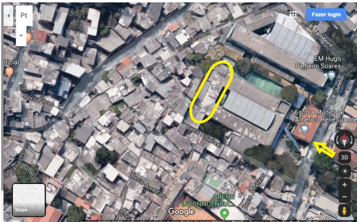
Imagem 01: Mapa de Localização da Escola