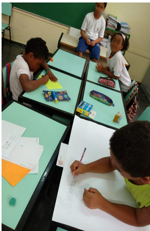
Imagens 04, 05 e 06: Produções dos alunos em sala de aula