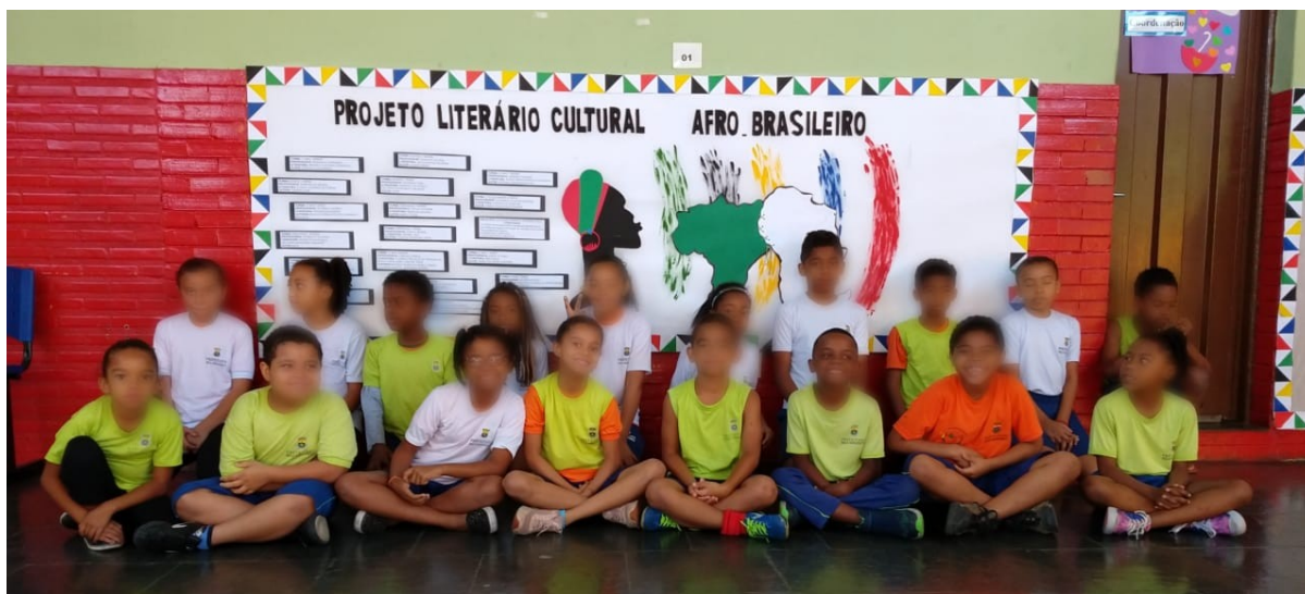
Imagem 02: A turma