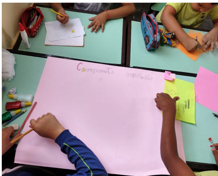
Imagem 03: Construção de cartazes

Após trazerem os registros, o cartaz foi construído contando com a participação de cada um dos alunos e, durante o desenvolvimento da atividade, ratifiquei a necessidade de cada um se empenhar no processo de construção do conhecimento. Se não fizerem as atividades, faltarem às aulas e se esquecerem dos assuntos estudados, dificilmente terão sucesso em seu desenvolvimento e isso vale para qualquer atividade que estejam desempenhando.