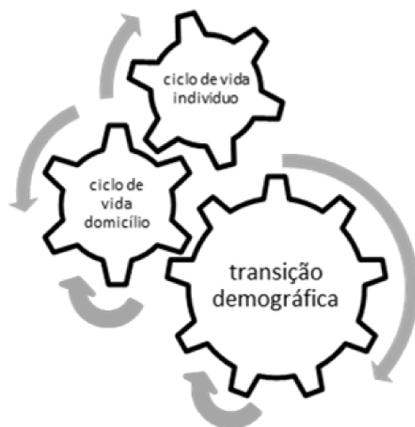
Figura 2 – Articulação entre as transições e seus níveis escalares

A Figura 2 mostra essas ideias de forma esquemática, fazendo uma tentativa de “colocar em movimento articulado” os aspectos apresentados na Figura 1.