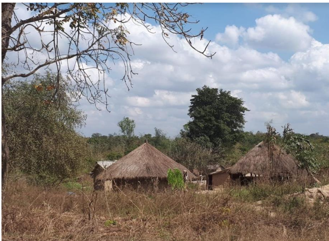
Casas do interior

próprio; são vistos circulando pela cidade muitos veículos “caindo aos pedaços”; os poucos carros bem conservados são em sua maioria de estrangeiros ou políticos. O trânsito é tranquilo e só há congestionamento próximo aos supermercados.