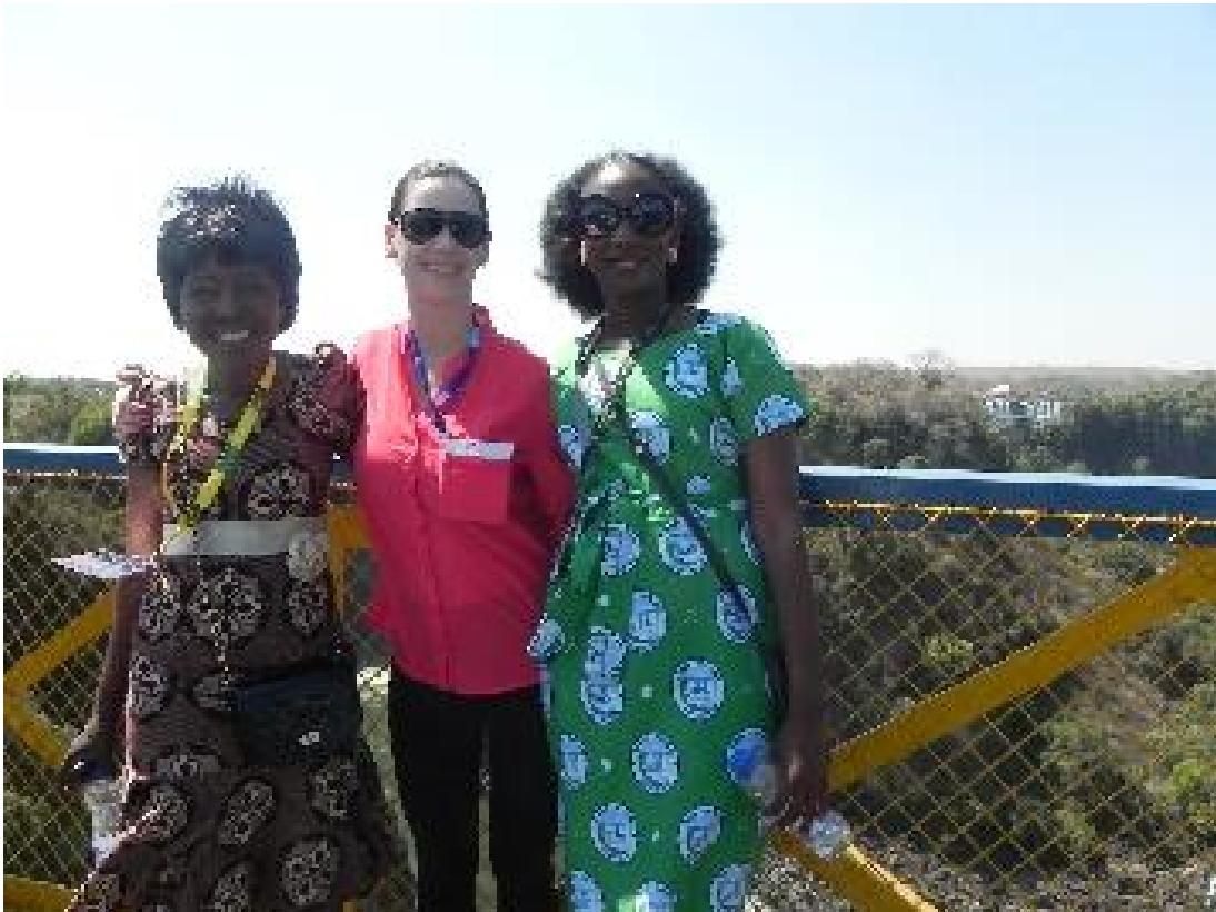
Primeiro encontro – visita à ponte que liga a Zâmbia e o Zimbábue

Com esta experiência juntos, o vínculo com estas três pessoas se estreitou e foi fundamental para toda minha experiência nesta viagem. Ganhei outros três amparadores intrafísicos. Com a amizade destas três pessoas, pude conhecer um pouco mais da realidade, coisa de turismo, que tem interesse de conhecer como vivem as pessoas do local, o que me rendeu visitas ao supermercado, restaurantes populares e outros lugares normalmente frequentados apenas pelos locais, além de longas conversas sobre política, costumes locais, emprego, renda e todas as curiosidades que eu tinha sobre cada país. Eles me acompanharam até o final da viagem, e fizeram questão de ir até o aeroporto e esperar o voo comigo.