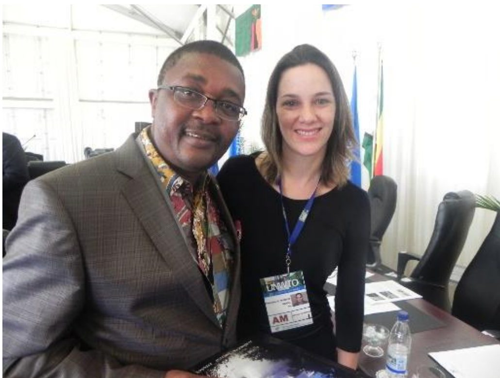
Entrega de material de Foz do Iguaçu ao Ministro do Turismo do Zimbabwe