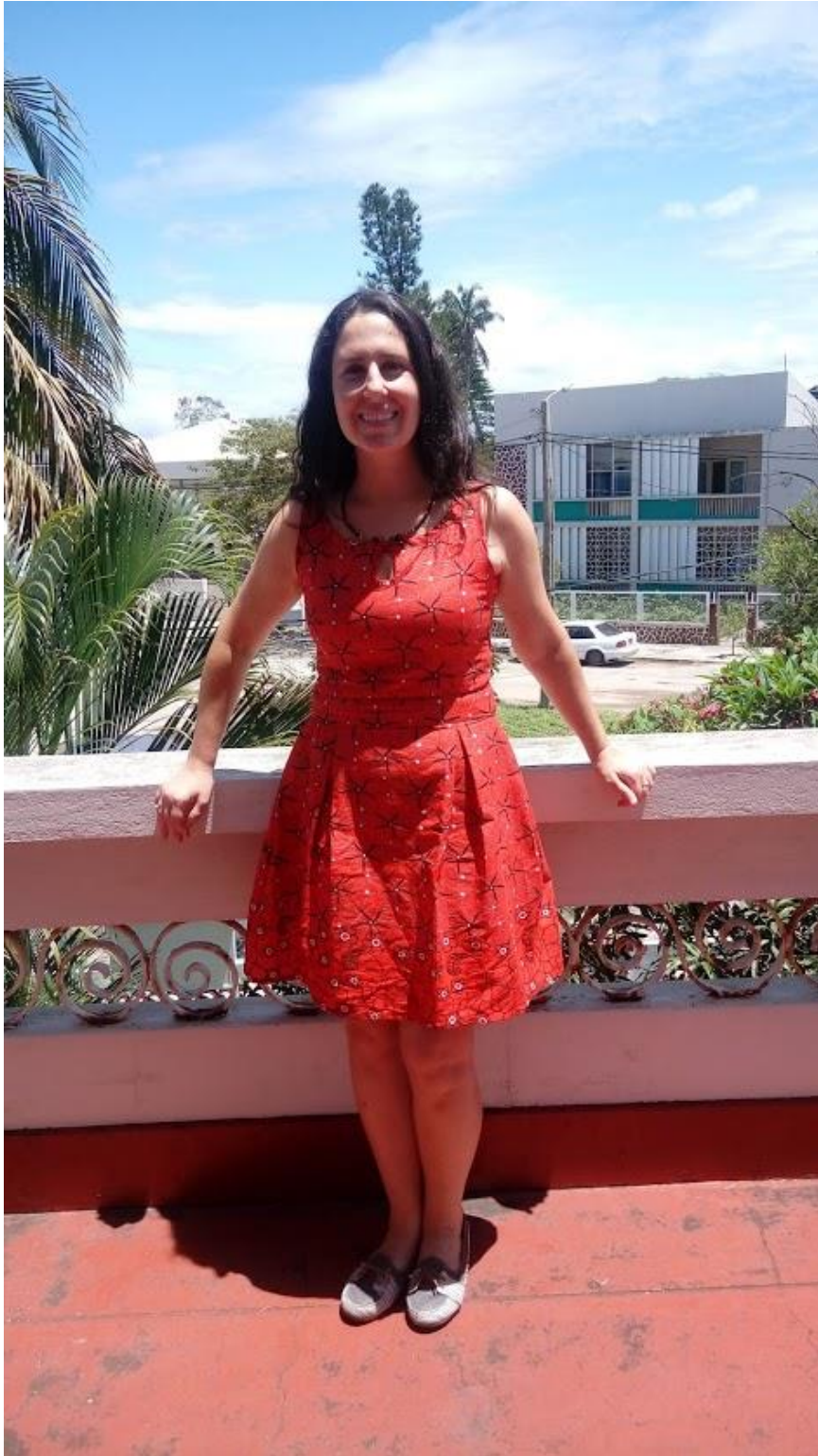
Vestido de aniversário de capulana