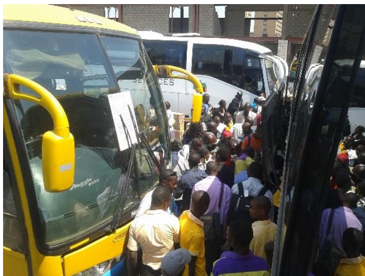
Embarque da viagem Lusaka/Livingstone

A simples tarefa de colocar a mala no bagageiro do ônibus era uma verdadeira odisséia. Empurra-empurra, calor, sem qualquer organização, todos tentavam de qualquer maneira fazer caber a mala e tudo mais que carregavam para a viagem. Tirei a foto de dentro do ônibus, observando a cena e vendo minha amparadora bravamente tentando colocar minha mala no ônibus. A viagem foi tranquila e pude conhecer um pouco mais da realidade daquele país, por meio desta senhora que me acolheu, além de interagir com outras pessoas dentro do ônibus, afinal, foram sete horas de viagem.