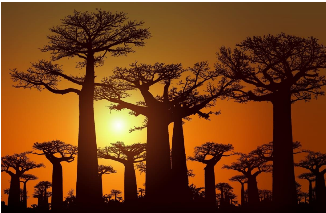
Os baobás, árvores africanas centenárias

https://biblioafrica.wixsite.com/meusite (endereço provisório)