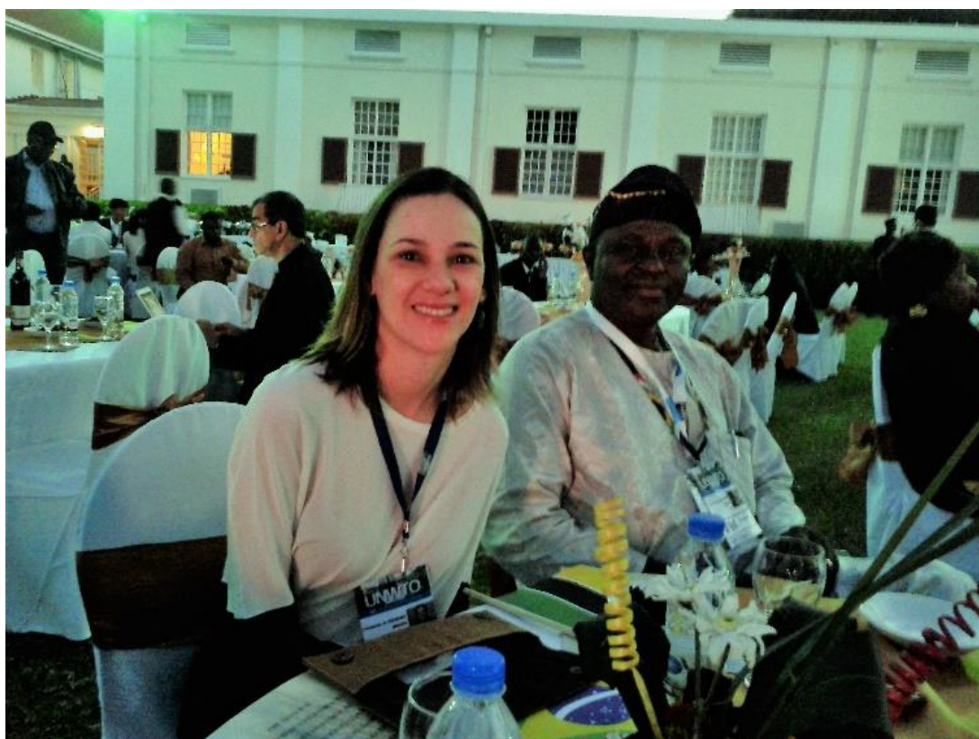
Cerimônia de Abertura