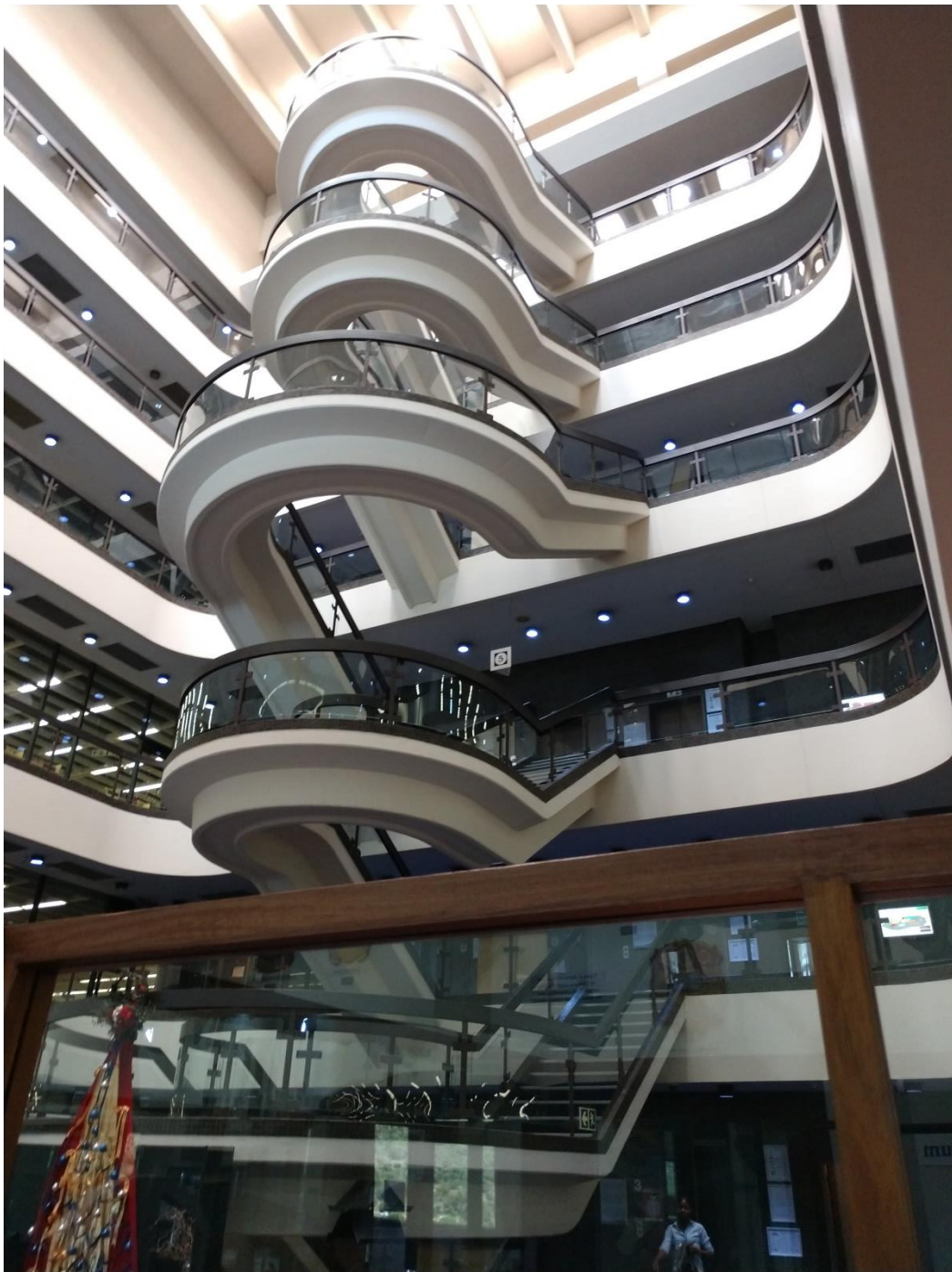
Biblioteca da Universidade de Pretória, África do Sul