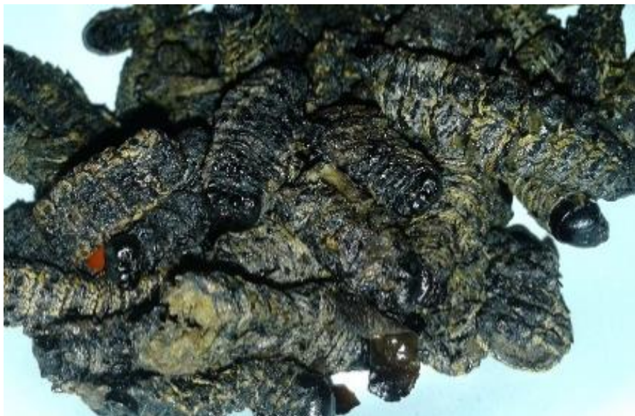
A iguaria - Larvas mopanes 6