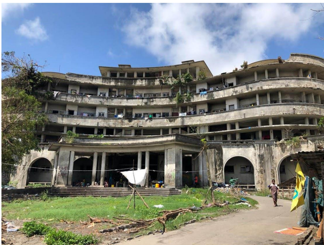
Grande Hotel atualmente

é o Grande Hotel, um antigo hotel de luxo que foi abandonado e durante a guerra civil virou um campo de refugiados. O hotel foi totalmente saqueado e nele, atualmente, residem milhares de desabrigados que vivem em péssimas condições de higiene e segurança, devido ao risco de desabamento. Com a experiência de trabalho na ONG, ficou evidente que se tornou um local para comércio de drogas e prostituição.