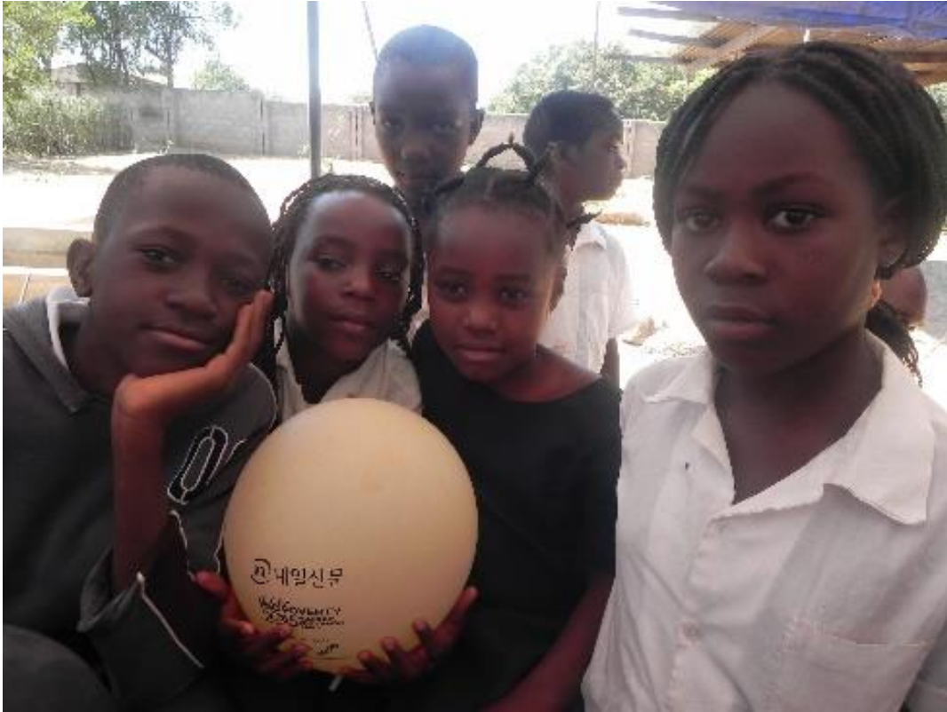
Momento de descontração com as crianças