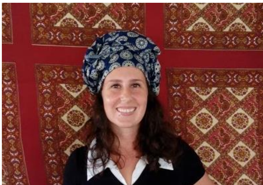
Enfeite de cabeça de capulana

Em algumas localidades do norte de Moçambique, a forma como a mulher amarra a capulana determina o seu estado civil: casada, solteira, divorciada, viúva, noiva, etc (6). As capulanas são vendidas em pedaços em lojas específicas desse produto. As lojas de capulanas têm centenas de texturas expostas nas paredes de diferentes preços. Você escolhe a estampa, compra o pedaço de tecido e leva para o alfaiate confeccionar sua peça de capulana.