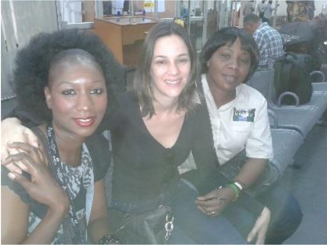
Despedida no Aeroporto