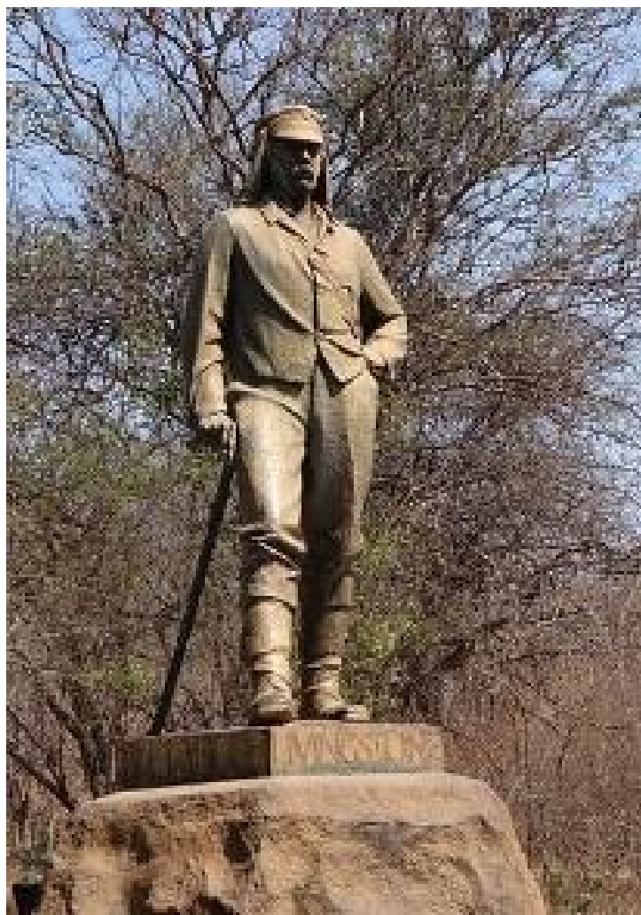
Estátua de David Livingstone

e pelo qual tive e tenho bastante afinidade, além dele ser protestante e ter lutado contra a escravatura, temas com os quais eu me afinizo.