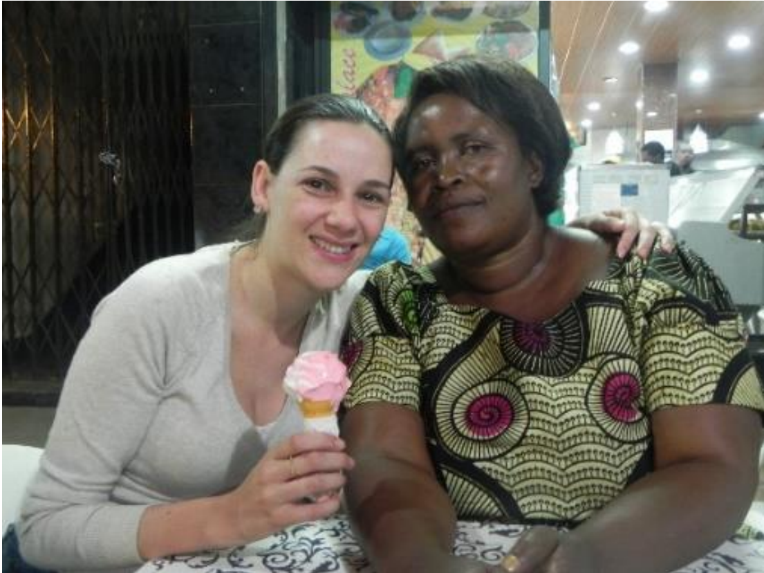
Encontro no meu último dia em Livingstone com minha amparadora intrafísica

Enfim, cheguei a Livingstone. A cidade tem como uma das suas figuras ilustres o missionário e médico escocês David Livingstone. Ele está para a Zâmbia assim como Santos Dumont está para Foz do Iguaçu, foi o “pai” do Parque Nacional deles, quem “descobriu” e batizou as Cataratas de Vitória, em homenagem à Rainha da Inglaterra na época. Eu me lembro de ter ficado curiosa e parada durante um bom tempo em frente à estátua dele durante a visita ao Parque Nacional Mosi-aotunya, onde estão as Cataratas de Vitória. Hoje, acredito que o personagem pode ter provocado alguma lembrança que não tinha lucidez na época para compreender. Dentre as possíveis conexões que posso fazer com esta personalidade é o fato da sua nacionalidade ser escocesa. A Escócia é mais um país fora do roteiro turístico que conheci,