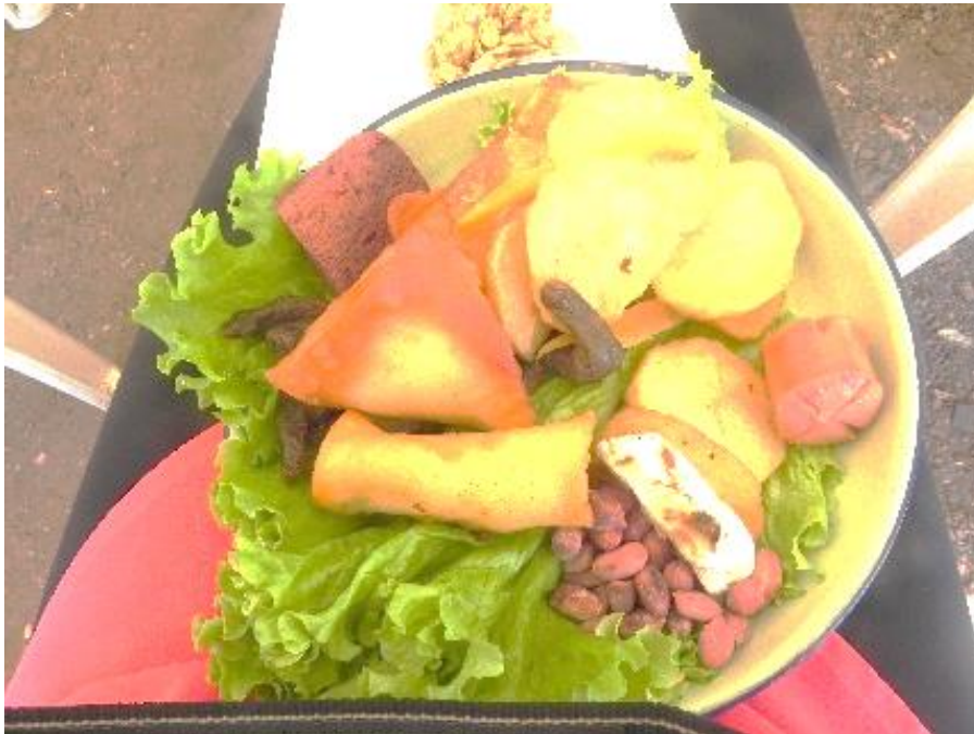
Prato de comidas típicas oferecido durante o evento

Desde que cheguei no continente africano, me senti em casa, o clima, a paisagem, as pessoas e a comida. Com exceção desta “iguaria” para os zambianos e zimbauenses, esta larva que experimentei, a comida nestes países é muito similar à comida brasileira, muita salada e frutas tropicais.