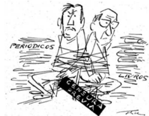
Figura 3. O Estado de São Paulo , 10/07/1970, p. 4. Hilde .

Porém, a crítica a algumas facetas autoritárias do período Médici não significou rompimento com a ditadura. O jornal continuou na linha da “revolução” e apoiando a repressão ao “terrorismo”, especialmente quando o Brasil era alvo de críticas internacionais. Por isso, o jornal publicou irado editorial (em 22/5/70) quando o Estado norte-americano cortou 150 milhões de dólares de créditos para o Brasil, por pressão de setores preocupados com o aumento da violência política. O editorial atacou com especial virulência o senador Ted Kennedy, considerado o líder da campanha, a quem chamou, sutilmente, de bêbado. Segundo o editorial, o jornal não concordava com os rumos políticos do governo Médici e preocupava-se com certas correntes totalitárias que tentavam forjar uma ideologia para a revolução. Porém, achava que a decisão norte-americana seria contraproducente e só agradaria aos totalitários de esquerda e direita, prestando um desserviço à democracia.