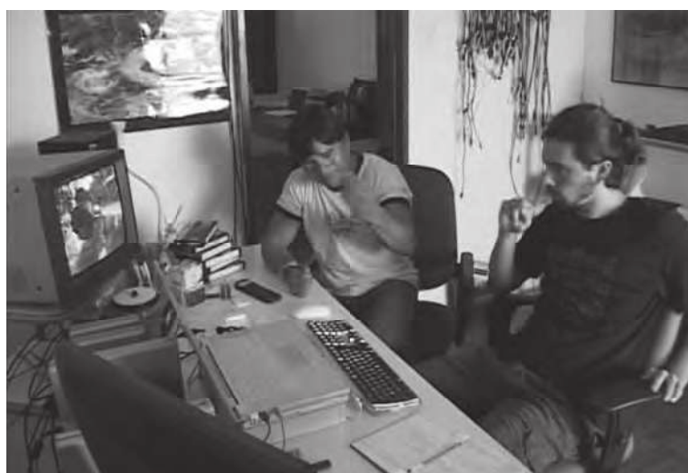
Figuras 5, 6 e 7. A cena “erodida” de Pi’õnhitsi .