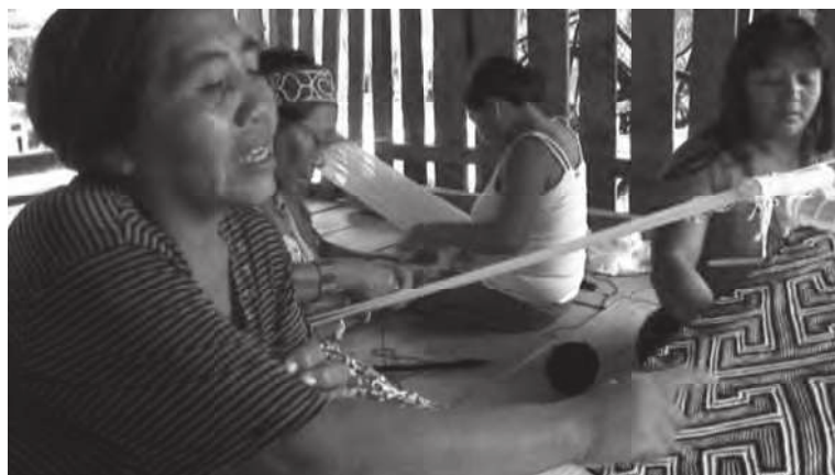
Figura 11. Aprender a ver.

Fonte: Kene Yuxi — As voltas do kene , 2010.