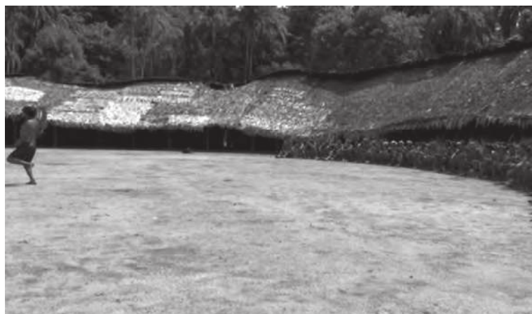
Figura 14. Trabalho com o invisível.