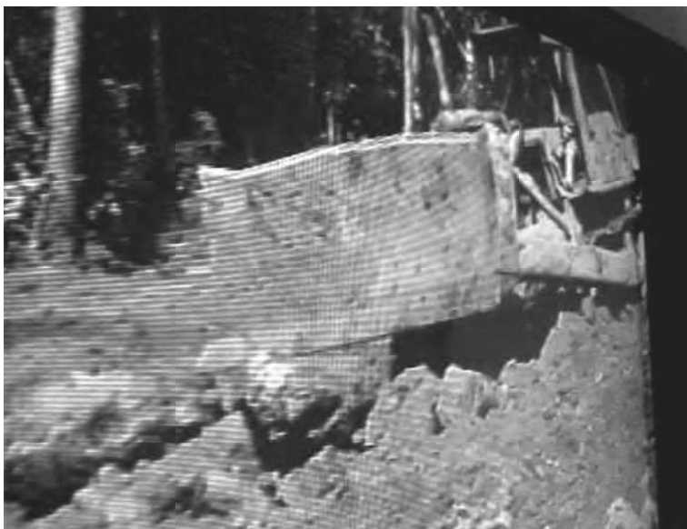
Figuras 2 e 3. O garimpo em terras waiãpi.