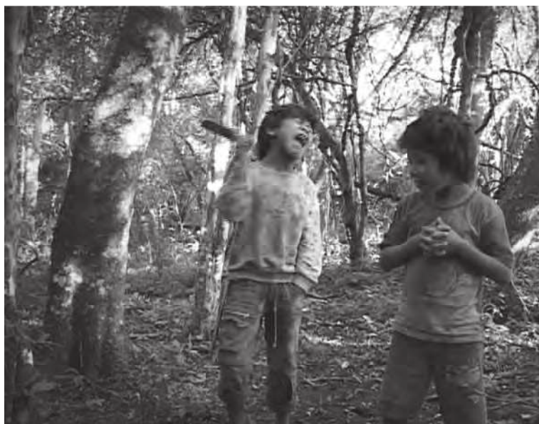
Figura 13. Violência do extracampo.