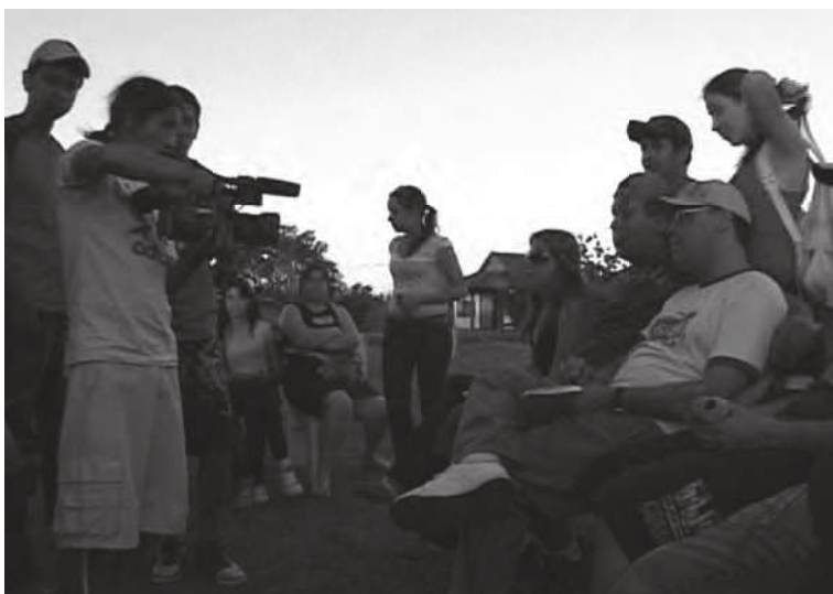
Figura 12. A cena “equivoca” de Mokoi Tekoá Petei Jeguatá — Duas aldeias, uma caminhada , 2008.

ciona, entre uma e outra conversa, é feito dessas lascas do plano mítico (o extracampo) no plano do cotidiano.