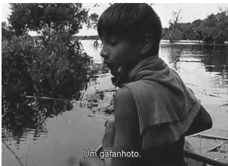
Figura 4. Filmar e compartilhar a pescaria.

De modo a compor um breve e provisório conjunto, lembremos de alguns filmes — vários já analisados em outros artigos 42 —, cada