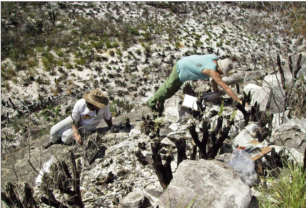
Figura 7. A Lapa da Ciranda tem o material lítico lascado acumulado em patamares rochosos, parcialmente recobertos de depósitos sedimentares muito rasos e canelas-de-ema ( Velloziaceae ).

O material lascado distribui-se pelos 'degraus' do afloramento, concentrando-se próximo aos abrigos, sobretudo junto ao Abrigo Norte, mas a maior parte do material deposita-se fora das áreas abrigadas, onde