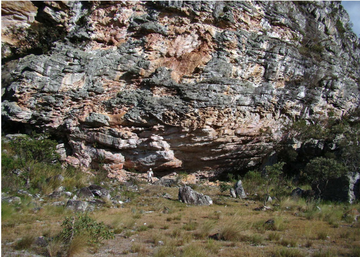
Figura 6. A Lapa do Boi, onde o material se distribui desde a área abrigada até o campo diante do abrigos, sem descontinuidade topográfica. Foto: Vanessa Linke (2010).

No Boi, encontram-se seis plano-convexos sobre plaquetas de quartzito, a maioria dos quais evidenciando claras indicações de reforma e gumes esgotados. Na lapa, encontram-se também núcleos de múltiplos planos de percussão, que utilizam o quartzito disponível ali mesmo, com dimensão máxima inferior a 10 cm. Estão ali presentes todos os grupos de artefatos, exceto o 9 (plaquetas muito delgadas), o 12 (de gume em chapéu), o 13 e o 14 17 . Todos os grupos de artefatos de quartzito