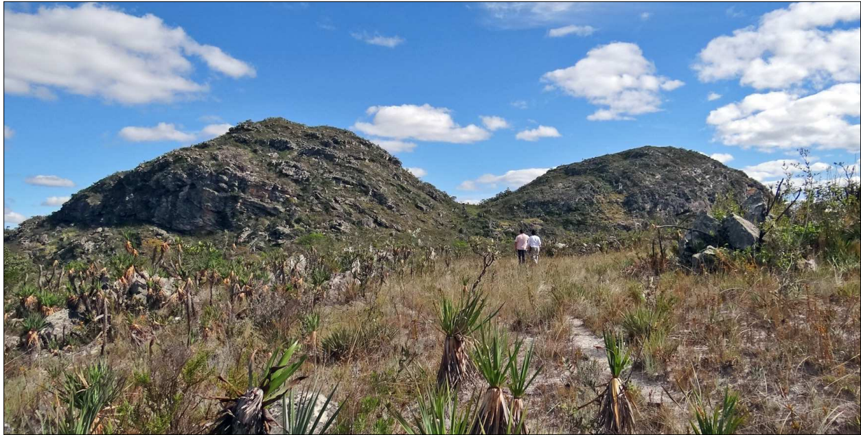
Figura 2. Afloramentos rochosos e vegetação típica da área de Diamantina.

de clivagem) 3 , produzindo uma mistura entre refugos de lascamento contemporâneo e material lítico indígena 4 .