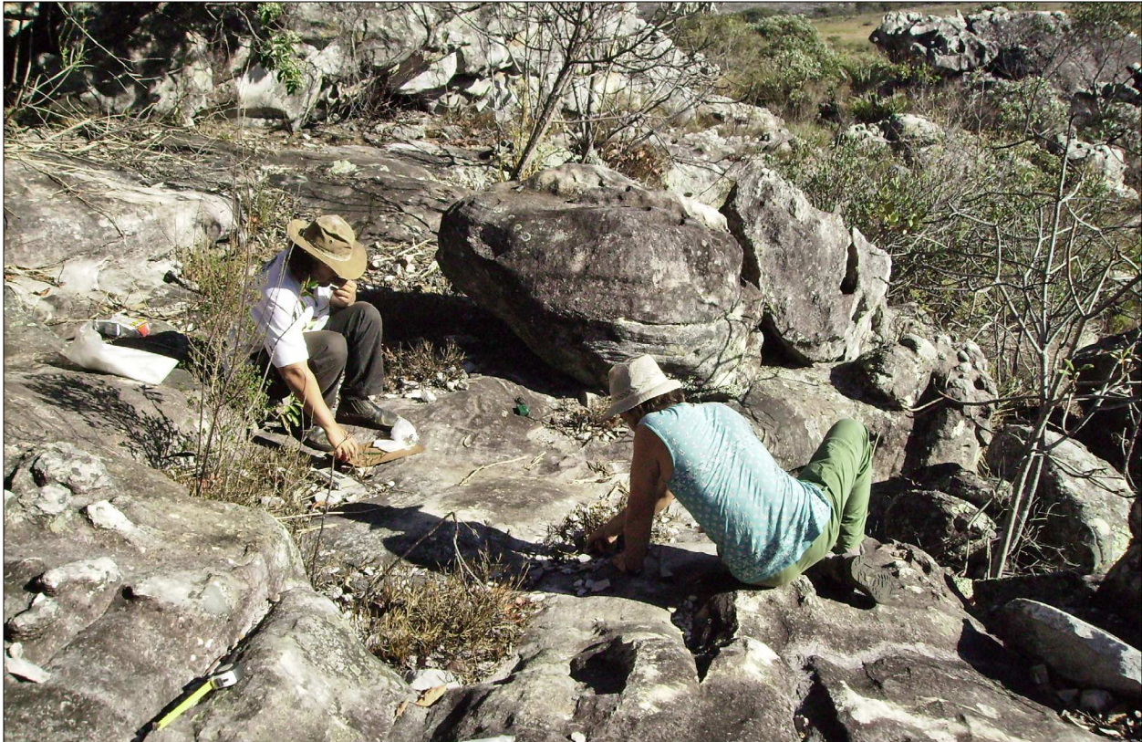
Figura 8. Coleta de material arqueológico nos patamares rochosos do sítio Lapa da Bandalheira, sendo conduzida no momento do registro por Ângelo Pessoa e Rafael Miranda.

A Lapa da Bandalheira está situada no sopé de um afloramento de altura modesta, junto a uma área de campo, sendo, porém, separada desta por pequenos afloramentos desconexos e uma faixa de vegetação de cerrado. O sítio é constituído por um lajedado, com cerca de 40 m de comprimento e de 10 a 20 m de profundidade, formado por múltiplos patamares (e rampas que os conectam), ao fundo do qual se define uma área abrigada irregular, que contém porções restritas de piso sedimentar (Figura 8). O material lascado e o material naturalmente desprendido das paredes acumulam-se na pequena