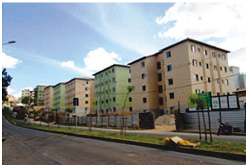
Residencial Jaqueline, Belo Horizonte Construtora Marka