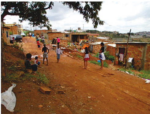
Figura 5 – Casas na ocupação Eliana Silva, Belo Horizonte

Nesse sentido, o agir cotidiano comum, que tem o conflito como seu gerador (seja pela presença dos moradores e pesquisadores, seja pela ausência do Estado), resgata a experiência do pensamento prático na medida em que se insere em uma comunidade política. Considerando que a comunicação efetiva só é possível se, e somente se, as experiências e as vivências são livremente expressas (a liberdade de criação), o processo produtivo baseado na informação compartilhada permite a elaboração de uma outra lógica da prática – o agir não se faz pela reunião de um grupo nem pelo indivíduo, mas a partir da informação que faz sentido a cada um na busca e na criação pela identificação primeira do todo – a comunidade política.