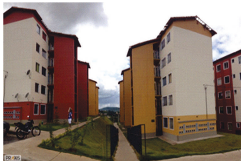
Residencial Hibisco, Jd. Vitória, Belo Horizonte Construtora Emcampp