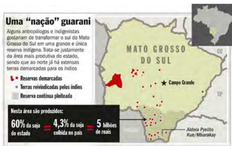
Figura 3: Mapa de demarcações em MS segundo Veja, edição de 04/12/2012

O mesmo tipo de tratamento à luta indígena reverbera na imprensa nacional, como no caso da reportagem “A Ilusão de um Paraíso” da Revista Veja (04/11/2012), como parte de uma ofensiva após a causa Kaiowa e Guarani ter ganhado grande repercussão em distintos fóruns (incluindo midiáticos) e um enorme apoio da opinião pública nacional e internacional.