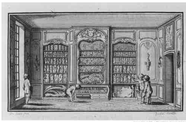
Figura 2 · Criança monstruosa pela transposição das vísceras, Tomo III, Prancha VIII, p. 204, da Histoire naturelle, générale et particulière, avec la description du Cabinet du Roy (1749), de Georges-Louis Leclerc, comte de Buffon.