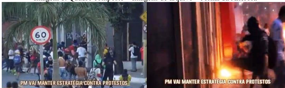
Imagem 8: Quadro composto – Imagens de arquivo – Jornal da Alterosa

Nesse momento, a reportagem traz imagens arquivo das manifestações do ano anterior, usadas de modo simbólico-metafórico, fazendo imergir um imaginário negativo dos manifestantes. São enquadramentos que mostram depredações e explosões, quase como um cenário de guerra.