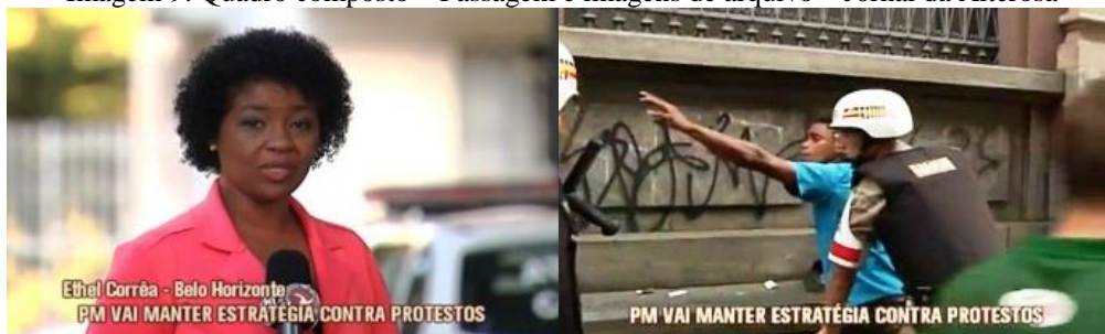
Imagem 9: Quadro composto – Passagem e imagens de arquivo – Jornal da Alterosa

A atuação da polícia como actante-agente da narrativa, responsável por prisões em flagrante e evitando a depredação de patrimônio, evidencia mais uma vez o reforço do imaginário de crença dos policiais como profissionais eficientes, heróis do dia a dia. Esse imaginário positivo em relação à polícia, e negativo em relação aos manifestantes, ganha ainda mais força na composição de vozes opinativas de pessoas aleatórias no final da reportagem: “A atitude preventiva é a melhor opção, né?”; “Achei perfeitamente correto.