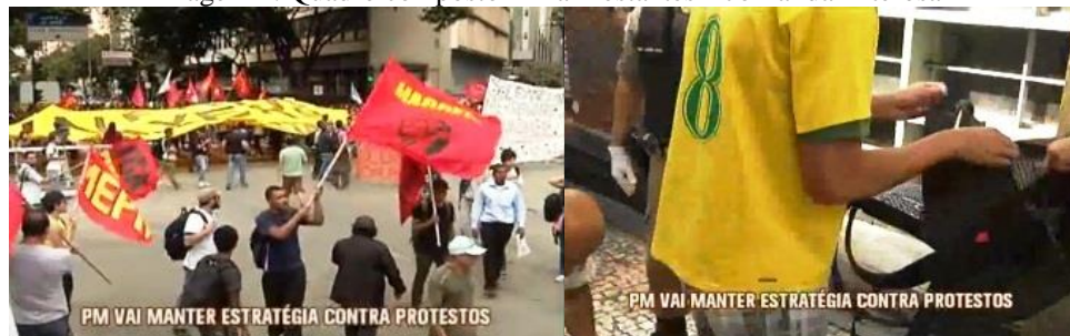
Imagem 1: Quadro composto – Manifestantes – Jornal da Alterosa

Em seguida, é dada ênfase ao fato de que quem circulava pelas ruas de mochila era revistado, causalidade lógica argumentativa explicada em sequência, motivo pelo qual os “militares” teriam encontrado um coquetel molotov nos pertences de um “homem”, legitimando a atuação da polícia. A cena é ilustrada à maneira indicial, com imagens testemunho que confirmam o roteiro verbal lido pela repórter.