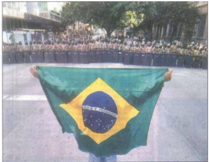
Jovem diante de militares durante protesto na Praça Sete: PM afirma que agiu para evitar tumulto e garantir segurança

Além de focar em uma faixa com os dizeres: “ Unfair players – Fifa – Police – Anastasia ”, a imagem faz uma referência aos “desmandos” da Fifa durante o mundial ocorrido no Brasil e a aludida (pelos movimentos sociais) subserviência dos diversos poderes ao capital econômico, representado pelo comitê de futebol. Além da crítica ao governo do Estado, indicado pelo nome do então governador grafado na faixa, há outra contra a polícia, considerada pelos manifestantes como uma espécie de segurança coordenada pela Fifa.