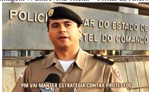
Imagem 7: Entrevista oficial – Jornal da Alterosa

Nesse momento, a reportagem traz imagens arquivo das manifestações do ano anterior, usadas de modo simbólico-metafórico, fazendo imergir um imaginário negativo dos manifestantes. São enquadramentos que mostram depredações e explosões, quase como um cenário de guerra.