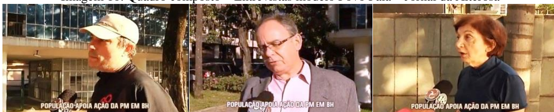
Imagem 10: Quadro composto – Entrevistas modelo Povo Fala – Jornal da Alterosa

É pertinente notar que todos os cidadãos que opinavam sobre o papel da polícia em relação aos atos dos manifestantes eram brancos e não houve divergência, numa concepção de unanimidade popular. A reportagem se encerra com a voz do major que afirma que a polícia respeitou o direito de manifestar e que utilizou “uma estratégia juridicamente perfeita e tecnicamente, operacionalmente, irrepreensível”. Nenhum manifestante foi entrevistado.