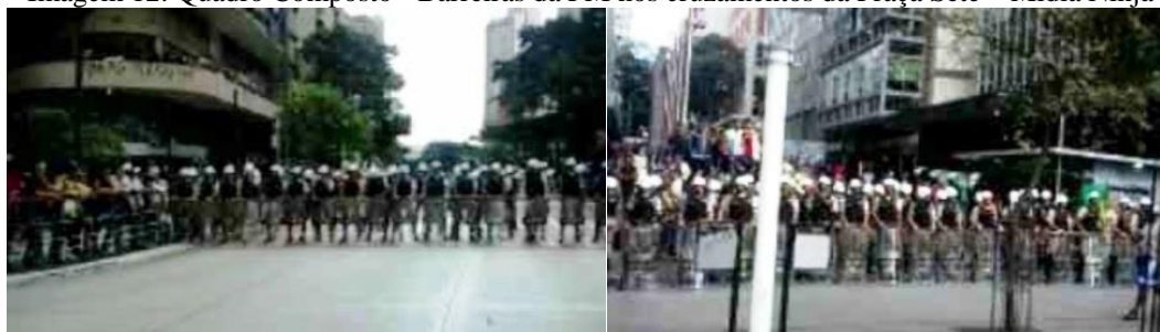
Imagem 12: Quadro Composto - Barreiras da PM nos cruzamentos da Praça Sete

A força bélica em grande quantitativo é contrastada pelo número ínfimo de manifestantes registrados, portando tão somente um megafone, além de bandeiras, cartazes e uma bola. A lúdica e inofensiva partida de futebol é registrada pelo Ninja, demonstrando a contradição frente ao cerco policial.