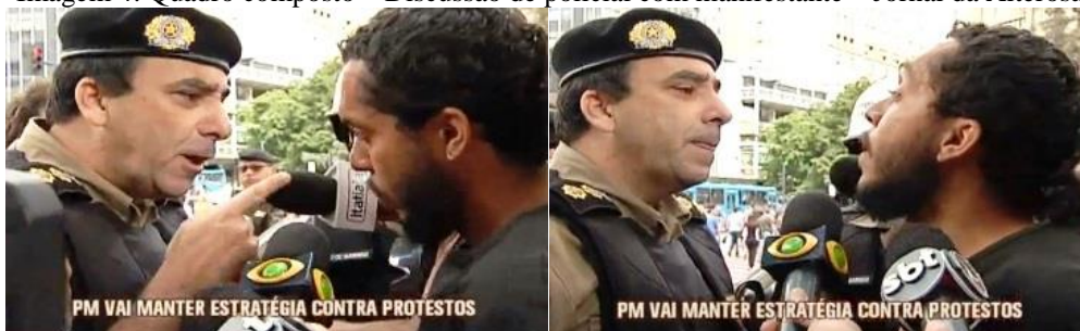
Imagem 4: Quadro composto – Discussão de policial com manifestante – Jornal da Alterosa

Com o dedo em riste e uma expressão séria, o policial diz: “Você não se envergonha? Eu fico envergonhado por você”. O manifestante esbraveja prontamente olhando fixamente nos olhos do policial: “Você que tá trabalhando pra gringo, você que tem que se envergonhar, tá sendo pago pra gringo pra reprimir a população dessa cidade. É isso. E a FIFA vai embora daqui a um mês e você vai ficar onde?”