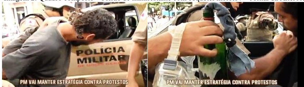
Imagem 2: Quadro composto – Prisão de manifestante com coquetel molotov – Jornal da Alterosa

A reportagem tem prosseguimento com a inserção aparentemente performática da voz do policial que prendeu o homem: “Amigo, olha pra mim, olha pra mim, olha! Você está preso em flagrante delito pelo crime de portar artefato explosivo e você será conduzido para uma delegacia. Você tem direito de permanecer calado.” A mise en scène da fala pausada do policial e sua gestualidade quase teatral tornam-se perceptíveis, numa rememoração às películas policiais dos anos 1980.