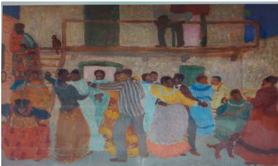
Imagen 1. Bailongo