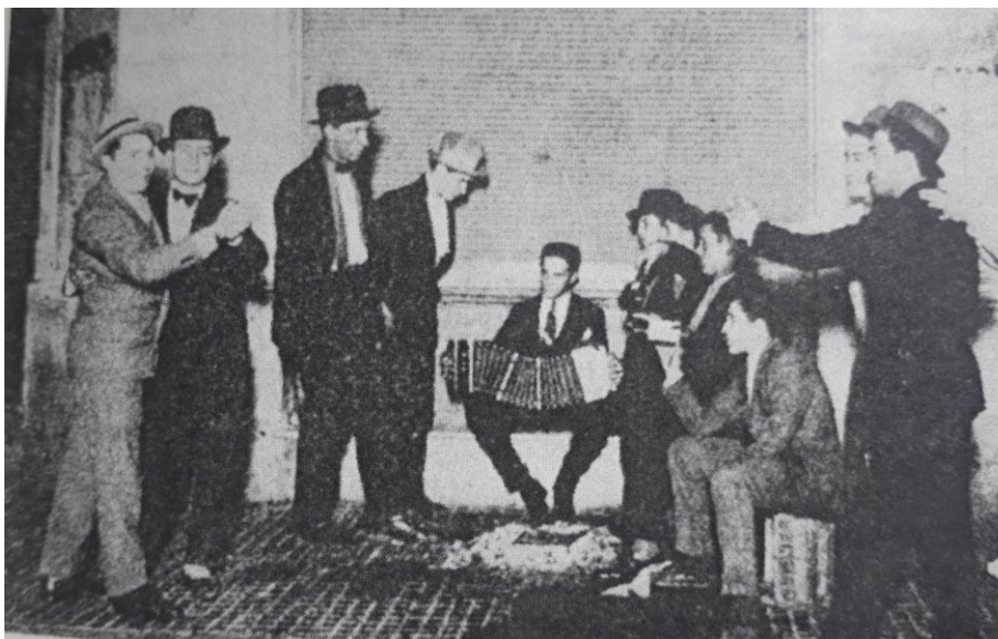
Imagen 2. Hombres bailando tango en las calles de Buenos Aires, 1900

Fuente: Francisco García Jiménez, El tango: Historia de medio siglo (1880-1930). Buenos Aires: Editorial Universitaria de Buenos Aires, 1965. IN Tango and the Political Economy of Passion pág.147.