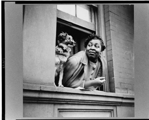
Imagem 3 – foto de Gordon Parks. Título: New York, New York. A woman and her dog in the Harlem section, 1943.

Ao nos depararmos com uma imagem de uma “personagem” debruçada na janela, por exemplo, não nos é possível conhecer seus pensamentos, sentimentos e desejos. A literatura aqui teria uma vantagem. Contudo, seja na imagem ou na narrativa ficcional, o que é vital para a valorização do momento qualquer é a “duração do tempo em si mesma, no seio da qual as coisas afetam as personagens, o sofrimento da repetição, o sentido de uma outra vida, a dignidade empenhada em perseguir o sonho e em suportar a decepção desse sonho” (RANCIÈRE, 2013b, p. 103).