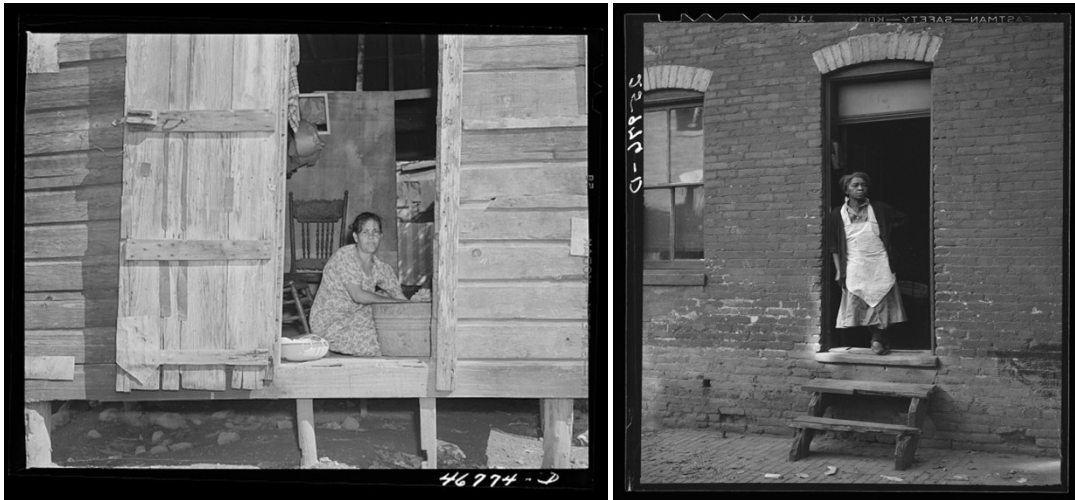
Imagens 4 e 5: Foto de Jack Delano, 1940. Legendas: “Ponce, Puerto Rico. In the slum area” e “Negro women in slum area, Washington, DC”.