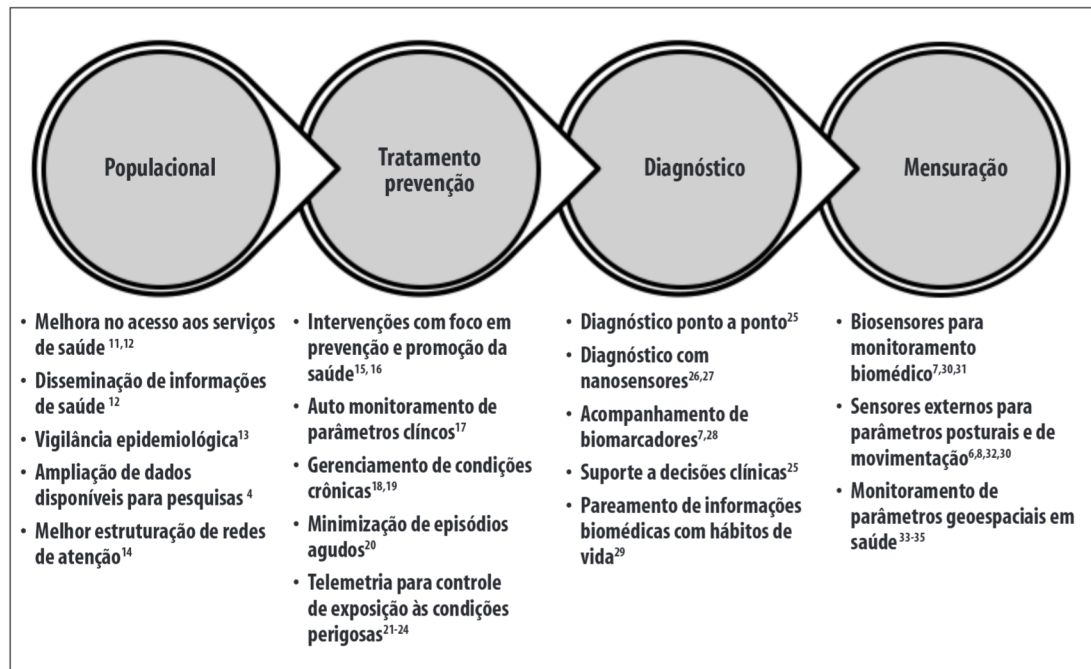
Figura 1 – Algumas possibilidades de aplicação da tecnologia de saúde móvel

assunto, tendo como parâmetro artigos completos, disponíveis no idioma inglês, publicados no período de 2000 a 2015, revisados por pares e que contassem com pelo menos um dos termos supracitados destacado no título do trabalho. Não foram empregados métodos de revisão sistemática da literatura.