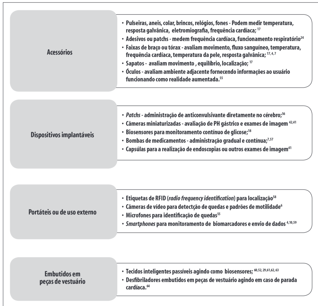
Figura 3 – Modalidades de hardware dos dispositivos vestíveis inteligentes