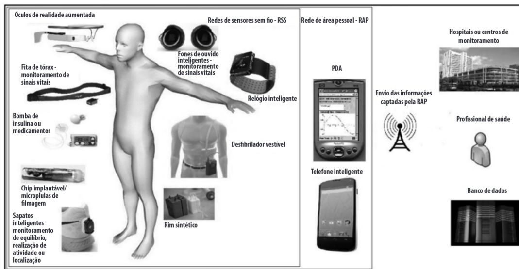
Figura 4 – Possibilidades de aplicação de hardware dos dispositivos vestíveis inteligentes e redes de transmissão de dados. Chip implantável/micropilulas de filmagem

Sistemas microeletromecânicos serão capazes de realizar a administração de medicamentos sem a intervenção do paciente, de acordo com a variação síncrona de parâmetros biomédicos. 4,39 Um bom exemplo ilustrativo desses sistemas são as bombas de insulina, capazes de controlar os níveis glicêmicos de indivíduos com diabetes: 7,17 a aplicação da dosagem correta de insulina, decorrente de determinado padrão de glicose no sangue, diminui a ocorrência de hipoglicemia, melhorando a qualidade de vida desses pacientes. 74 Inúmeros portadores de diversas patologias beneficiar-se-ão dessas melhorias terapêuticas, despreocupando-se dos horários e dosagens de seus medicamentos.