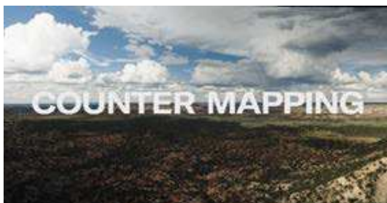
FIGURA 5: Frame do vídeo documentário Counter Mapping , de Loften e Vaughan-Lee (2018).