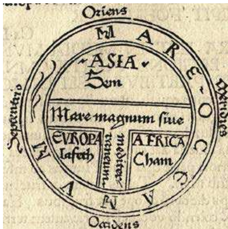
FIGURA 1: Mapa T-O.

fortemente influenciada por aspectos religiosos, que remetem tanto à tríade cristã como também a trechos do antigo testamento (ECO, 2013). Essa divisão, que coloca Jerusalém no centro do mapa, dificultou a incorporação de um quarto continente (a América) no imaginário dos europeus daquela época (ZUMTHOR, 1993).