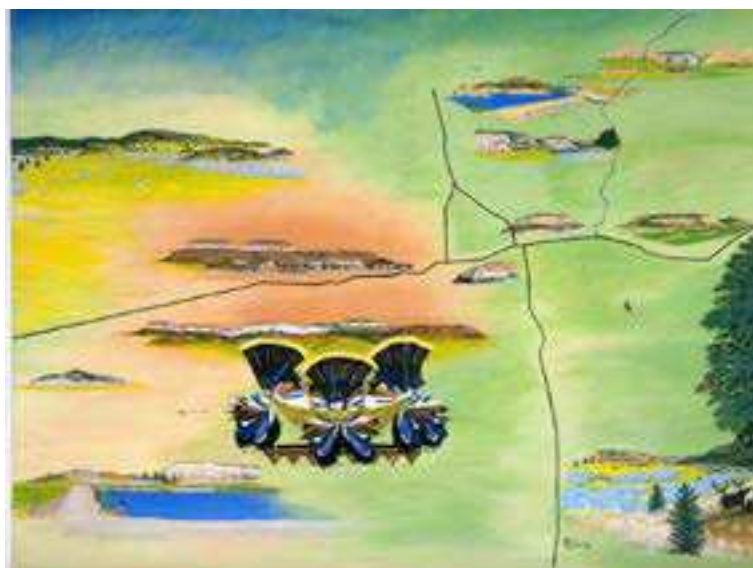
FIGURA 4: Ho'n A:wan Dehwa:we (Our Land), de Ronnie Cachini, 2006. Fonte: Loften e Vaughan-Lee (2018).