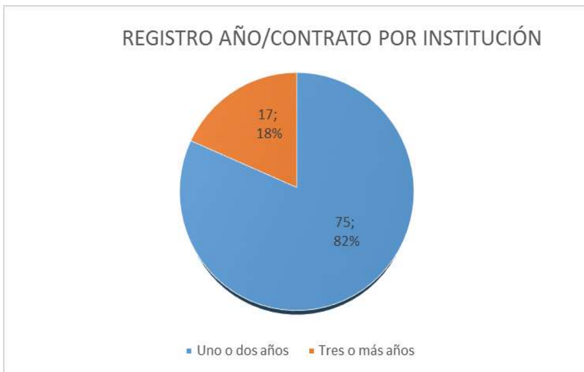
Gráfico 2 Registro de contratación

embargo, la discontinuidad de contratación fue muy grande, solo el 17% contrataron por tres años o más, lo que lleva a inferir una no continuidad en el trabajo con archivos o la sustitución por otro tipo de “mano de obra”.