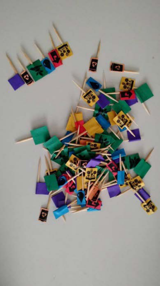
Fig. 2. Maquete da cartografia coletiva e ícones usados no mapeamento.

Foram levantados também, com apoio do grupo de pesquisa, mapas dos dados físicos, relativos ao relevo, micro bacias hidrográficas, limites da APP, legislação de uso e ocupação do solo, classificação viária, acessos, pontos de ônibus, velocidade dos ventos, equipamentos públicos, mercados e sacolões, adensamento da mata, geologia, caminhos presentes entre as ocupações e entorno, principais destinos no bairro. Esse levantamento provocou no grupo as seguintes questões: