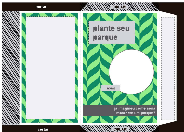
Fig. 3 – Layout do saco de sementes com espaço para resposta dos moradores