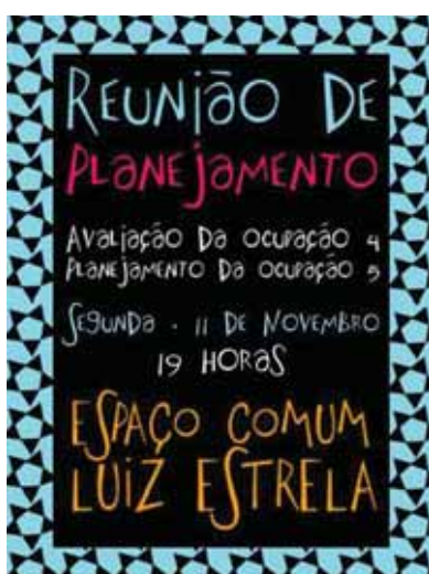
Foto 18: Folder de divulgação da reunião para planejamento do Espaço comum Luiz Estrela

Fonte: < https://www.facebook.com/espacoluizestrela/photos/a.589439317790744.1073741828.589433144458028/963779607023378/?type=3&theater > Acesso: 31 maio de 2016