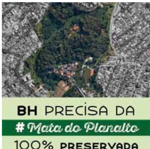
Foto 5: Folder de divulgação do movimento Salve a Mata do Planalto