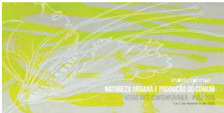
Foto 2: Folder de divulgação do evento Natureza Urbana e Produção do comum

Fonte: < https://www.facebook.com/naturezaurbanavac2016/?fref=ts > Acesso: 31 maio de 2016