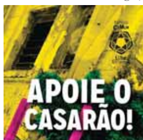
Foto 17: Folder de divulgação do financiamento colaborativo do Espaço comum Luiz Estrela

Fonte: < http://catarse.me/pt/espacocomumluizestrela > Acesso: 31 maio de 2016