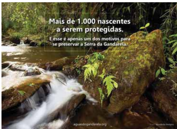
Foto 6: Folder de divulgação do movimento Salve a Serra da Gandarela