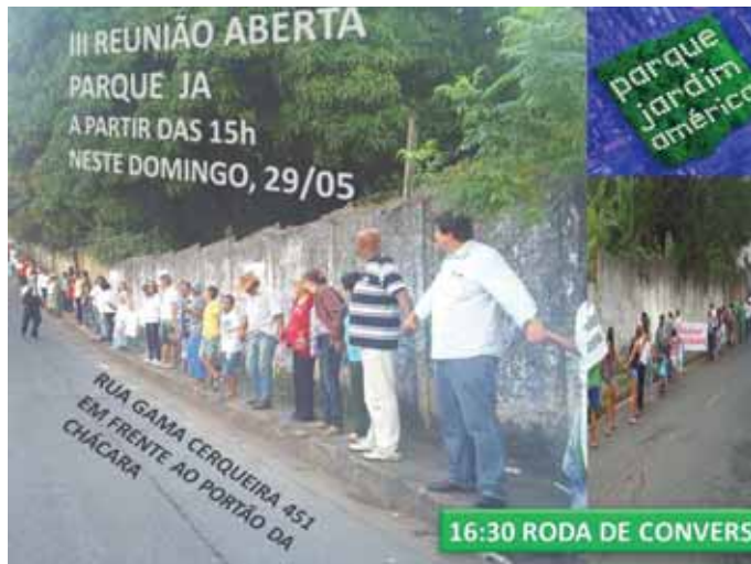
Foto 4: Folder de divulgação de reunião do movimento Parque Jardim América

Fonte: < https://www.facebook.com/ParqueJAbh/photos/a.1532259430371127.1073741828.1530980260499044/1696148047315597/?type=3&theater > Acesso: 31 maio de 2016