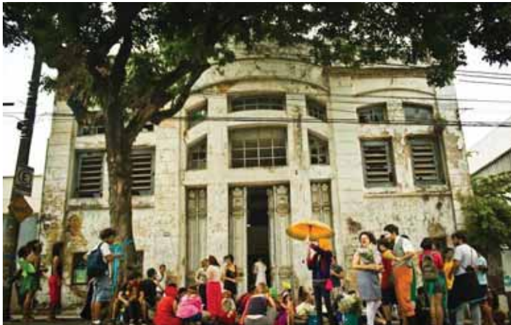
Foto 9: Ocupação do casarão por ativistas do Espaço Comum Luiz Estrela