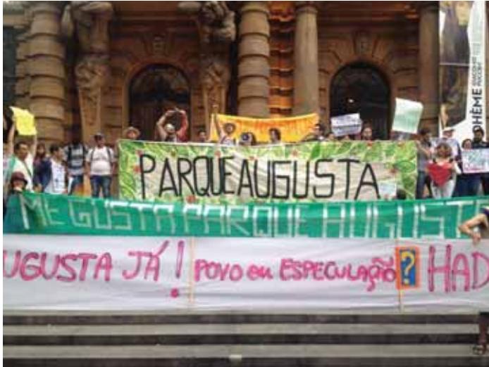
Foto7: Manifestação do movimento Parque Jardim Augusta