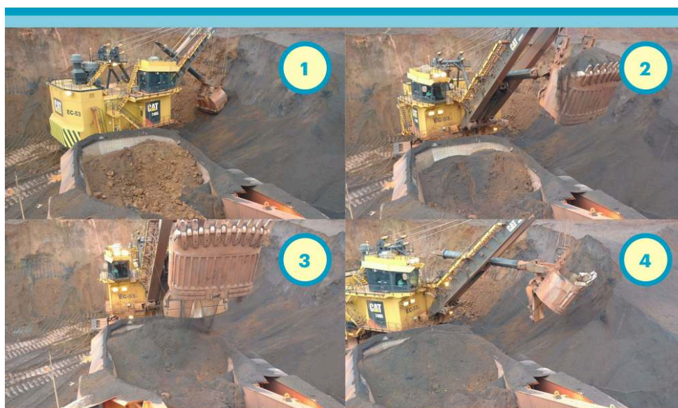
Figura 2 – Ciclo de extração e carregamento de minério de ferro realizado pelo operador