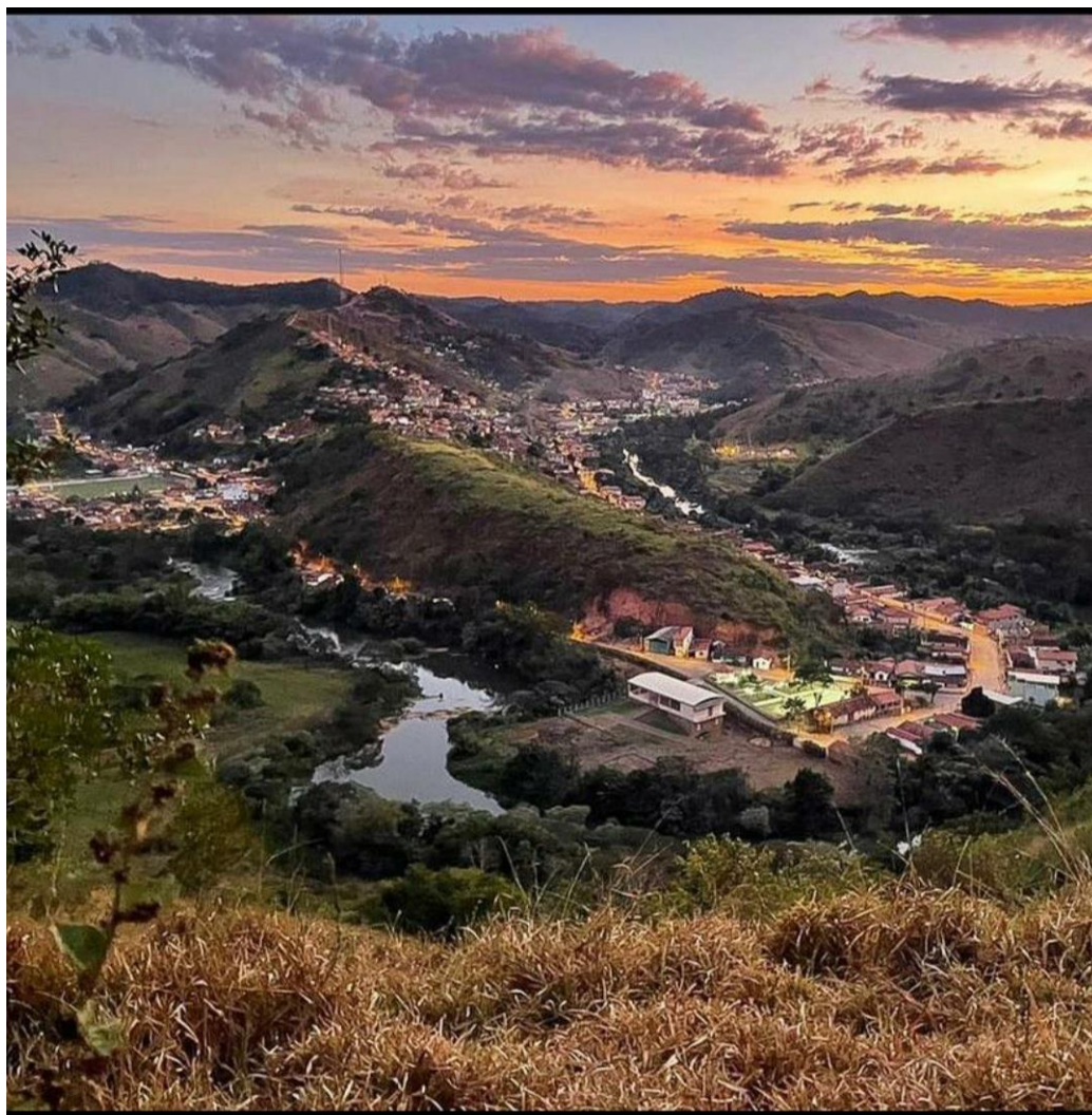
Figura 1- Fotografia da cidade São Pedro do Suaçuí-MG