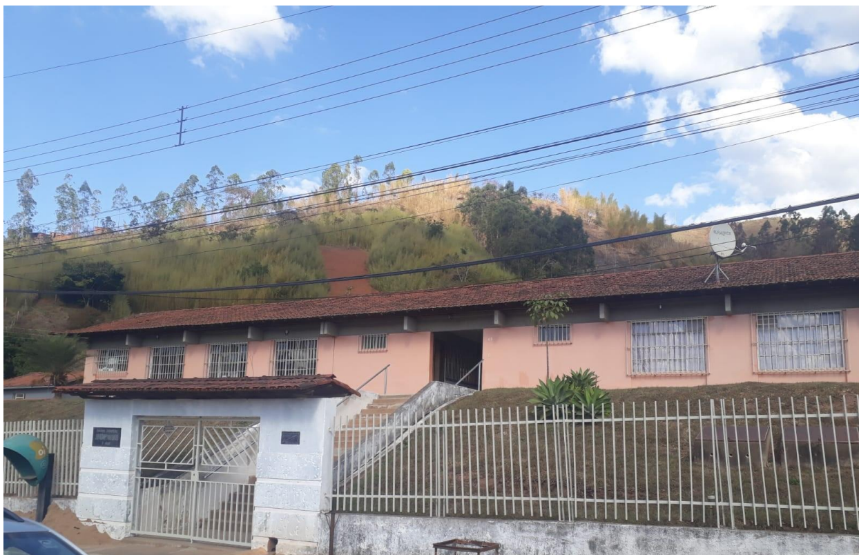
Figura 2- Fachada da Escola Estadual João Pinheiro São Pedro do Suaçuí-MG

comemorativas, como por exemplo “O dia do estudante”, fazem muito sucesso, a transmissão é acompanhada pela maioria dos estudantes e comunidade.