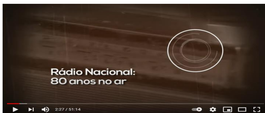
Figura 9 – Imagem ilustrativa do documentário