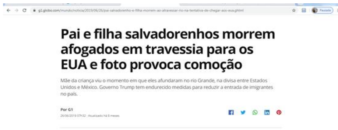
Figura 7 – Print da tela do Portal G1