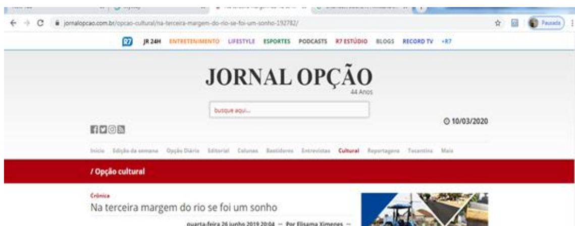
Figura 6 – Print da tela do Jornal Opção