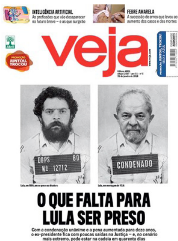
Figura 4 - Capa da revista Veja edição 2567 de 31 de janeiro de 2018

sentações, chamada de “pixuleco”: um boneco inflável de grandes dimensões, que trazia a imagem de Lula, em estilo de cartum, com roupa listrada de presidiário. Marca comercial registrada por movimentos de direita do país (FLECK, 2018), quase um ano antes da primeira denúncia formal contra Lula ser reconhecida pela justiça, ela se tornaria um dos principais ícones da campanha pela prisão do ex-presidente, conjugada ao clamor pelo impeachment de Dilma Rousseff. Em diversos momentos, capas de revistas semanais também acompanharam a produção desta iconografia, como, ainda em 2015, na edição 2450 da revista Veja , de 4 de novembro, que trazia montagem de fotografia de Lula em traje de presidiário, ecoando o boneco das manifestações. Entre outras capas que prefiguraram a prisão ou mesmo a decapitação de Lula 1 , é de particular relevância para esse artigo a que estampava a edição de Veja de 31 de janeiro de 2018, logo após a confirmação da condenação de Lula em segunda instância, que trazia – talvez pela primeira vez, de outras que viriam – a justaposição do retrato de 1980 a uma versão modificada, com o rosto de Lula em registro mais recente (Figura 4). A manchete: “O que falta para Lula ser preso”.