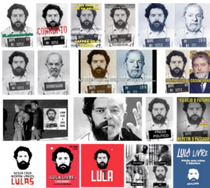
Figura 5 - Montagem com algumas das figuras, de autoria desconhecida, tomadas como corpus desse estudo coletadas a partir do Twitter entre 4 e 16 de abril de 2018

A recorrência do retrato de identificação policial de 1980 tornou-se perceptível na observação conduzida ao longo dos dois dias que antecederam à prisão, aparecendo tanto em sua forma original quanto em diversas releituras (Figura 5). Embora boa parte das figuras consideradas tenha sido coletada a partir de observação direta, a coleta automatizada permite situar tal circulação no plano aberto das interações colhidas no período 2 . De 4 a 16 de abril, foram coletados 7,9 milhões de tuítes, dos quais 2,4 milhões (30%) continham imagens, seja no próprio tuíte ou como preview de link para página externa 3 . Em meio a este conjunto, foi possível identificar, a partir de métodos computacionais aproximativos de comparação