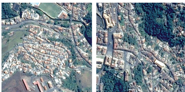
FIGURA 4 — Comparação entre a implantação na Vila Aparecida, à esquerda, e no centro histórico.