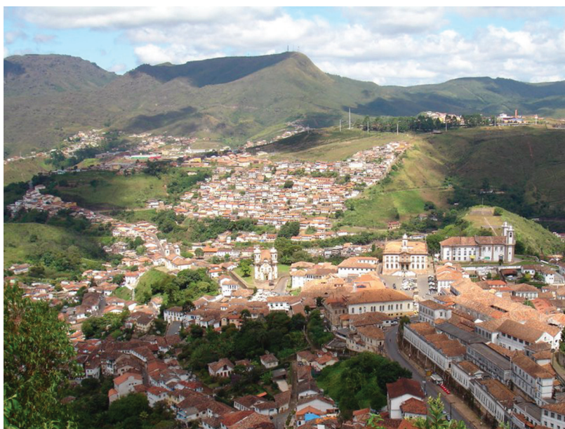
FIGURA 3 — Vista do centro histórico de Ouro Preto, com a igreja de São Francisco de Assis à esquerda e a Vila Aparecida como pano de fundo.