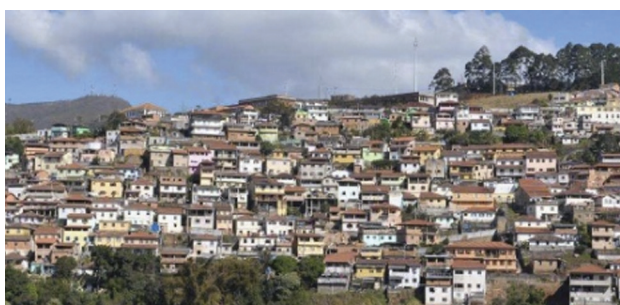
FIGURA 5 — Tipologia edilícia na Vila Aparecida.