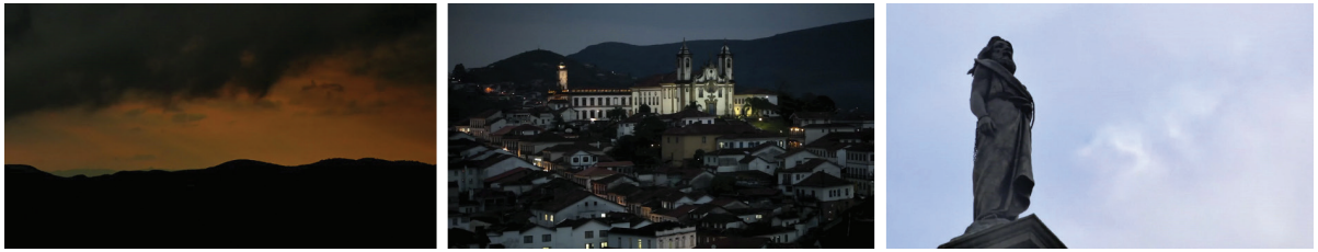
FIGURA 1 — Fotogramas do vídeo “Toada”, da Orquestra Ouro Preto.