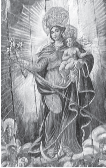
Fig. 1. Detalhe do forro da nave Nossa Senhora do Pilar e o Menino Jesus – Catedral Basílica de Nossa Senhora do Pilar, São João del-Rei – MG. Foto: Rita Cavalcante, Mai 2015.