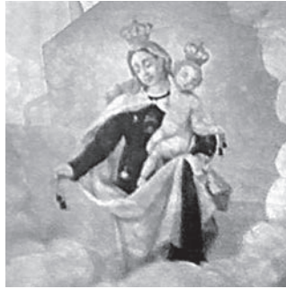
Fig. 2. Detalhe do Ex-voto Nossa Senhora do Carmo e o Menino Jesus – Igreja de Nossa Senhora do Carmo, São João del-Rei – MG. Foto: Rita Cavalcante, Jul 2015.

No primeiro exemplo, temos a imagem de Nossa Senhora do Pilar e de Nossa Senhora do Carmo (Fig. 1 e 2). Enquanto Nossa Senhora do Pilar dirige seu olhar diretamente para o observador, Nossa Senhora do Carmo observa a mulher que se encontra deitada no leito.