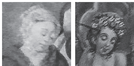
Fig. 3. Detalhes do ex-voto (esq.); Detalhes do forro da nave da Igreja Matriz de Nossa Senhora do Pilar (dir.).