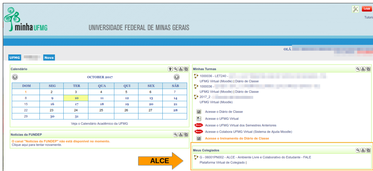
Figura 1 – localização do ambiente ALCE no espaço MinhaUFMG.