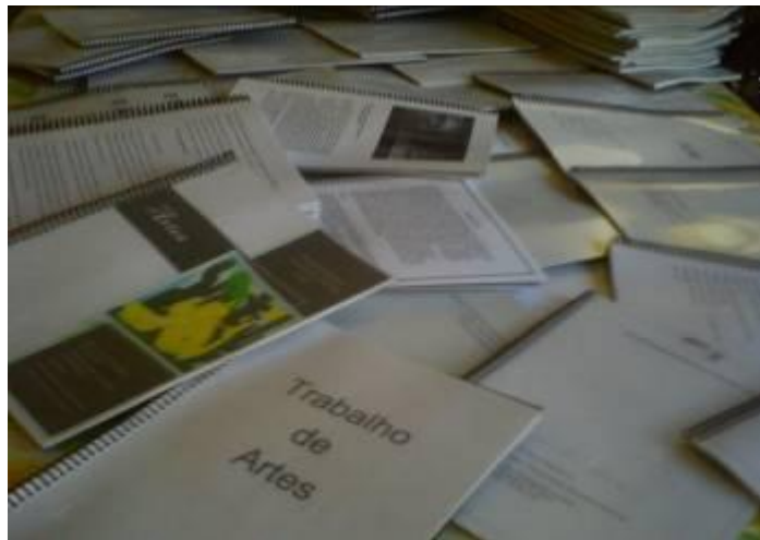
Foto 3 - Apostilas elaboradas pelos alunos