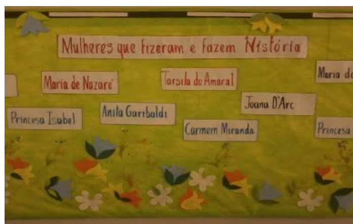
Foto 10 É Painel Í Mulheres que fizeram e fazem História