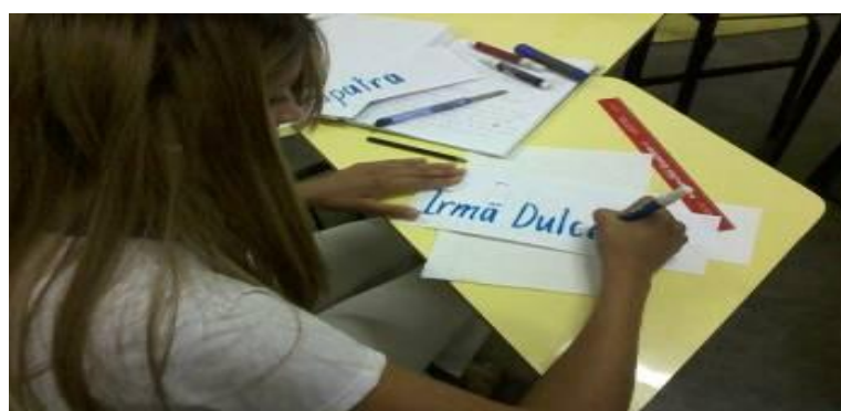
Foto 9 - Aluna elaborando mural sobre Mulheres que fizeram e fazem sua história.

única que pode proporcionar ao indivíduo uma educação e uma cultura de qualidade. Se a escola ou sala de aula proporciona cultura ao indivíduo e pintura é cultura, logo vem; por que não a pintura na sala de aula? Pois esta é um importante elemento da cultura. Para o indivíduo ter um conceito próprio e significativo sobre cultura, não basta apenas aflorar isso ao próprio, mas também, a experiência de fazer obras de arte ou pelo menos, tentar, saber analisá-las e compreendê-las de acordo com o seu conteúdo. Isso fortaleceria o elemento em questão talvez ou até, com certeza, poderíamos dizer que surgiriam mais artistas plásticos. Pois nem sempre, a vida é o que considera uma destino, muitas vezes este pode ser mudado pela escolha certa, acredito que depende de um dom de Deus para ser um artista plástico (destino), de oportunidades e escolhas certas que também é um dom de Deus (livre-arbítrio, direito de escolha), este, dom de Deus dado à cada indivíduo. Com certeza existem muitos indivíduos com o dom da pintura e falta oportunidades e o melhor lugar para o indivíduo subtrair essa oportunidade é em sala de aula, onde aprenderá e, conseqüentemente, irá retirar o proveito necessário para o conhecimento e aprendizado deste elemento importantíssimo da cultura mundial, a pintura.+