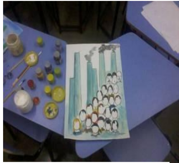
Foto 8 É Pintura Í OperáriosÍ