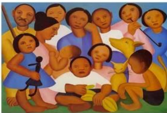
Figura 2 . Família

Em 'A Negra' (1923), C. R. de 16 anos expõe que nessa pintura temos elementos cubistas no fundo da tela e ela é também considerada antecessora da Antropofagia na pintura de Tarsila. Essa negra de seios grandes, fez parte da infância de Tarsila, pois seu pai era um grande fazendeiro, e as negras, geralmente filhas de escravos, eram as amas-secas, espécies de babás que cuidavam das crianças. Nota-se que o aluno consegue analisar a obra, percebendo o contexto histórico de Tarsila do Amaral e compreendendo o modo de vida de Tarsila do Amaral.