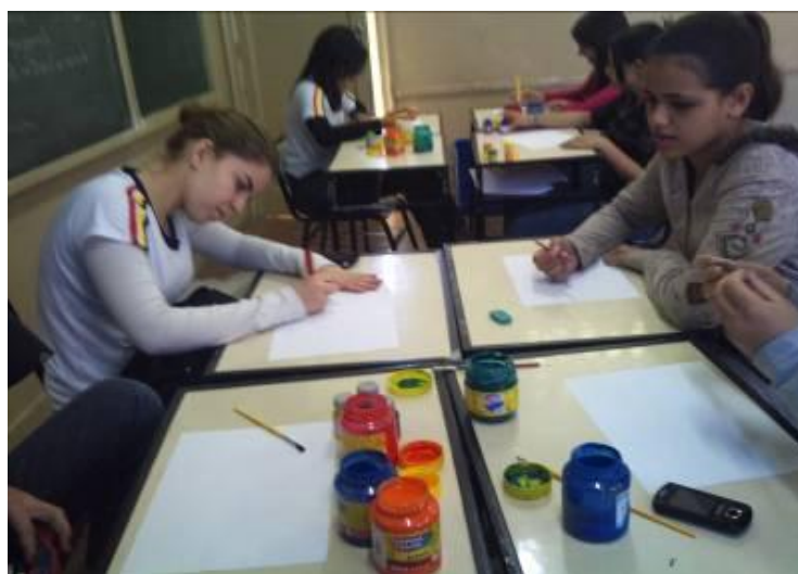
Foto 4 - E.E.I.A.L, alunos em prática - trabalho de pintura.

A partir dos questionamentos apresentados, a seguir algumas imagens que ilustram o desenvolvimento da proposta.