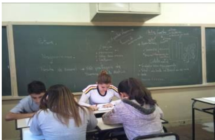
Foto 1 - Alunos elaborando relatório de aula. Tema: Modernismo, Pintura e Obra de Tarsila do Amaral.

É importante citar que os alunos desta turma são provenientes de outras escolas, talvez isso possa ter interferência no trato da disciplina de arte pelos mesmos. Já a turma 1º 01, está na escola desde o 6º ano do ensino fundamental. Os discentes desta turma acompanham o desenvolvimento do ensino de artes/arte pela autora desta pesquisa desde o 9º ano, havendo, portanto, a continuidade das propostas de trabalho, as dinâmicas e aceitação da arte como ciência.