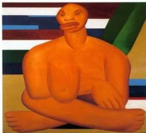
Figura 1 . A Negra

Ao analisar algumas obras de pintura da artista Tarsila do Amaral, os discentes apresentaram algumas argumentações sobre as telas referenciadas.