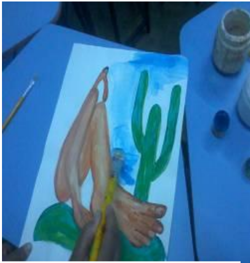
Foto 7 É Pintura Í Ababuruí