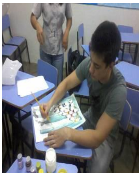
Foto 6 - Aluno pintando a obra 'Operários'