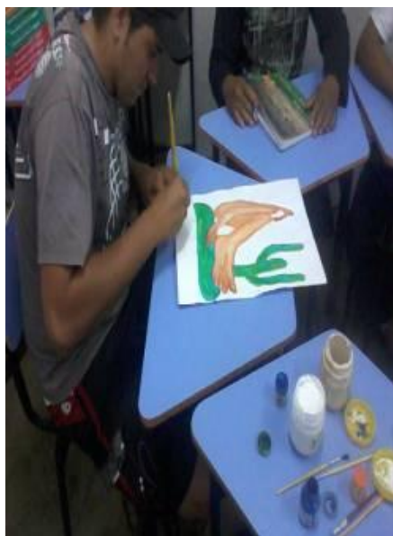
Foto 5 - Aluno pintando a obra 'Abaporu'