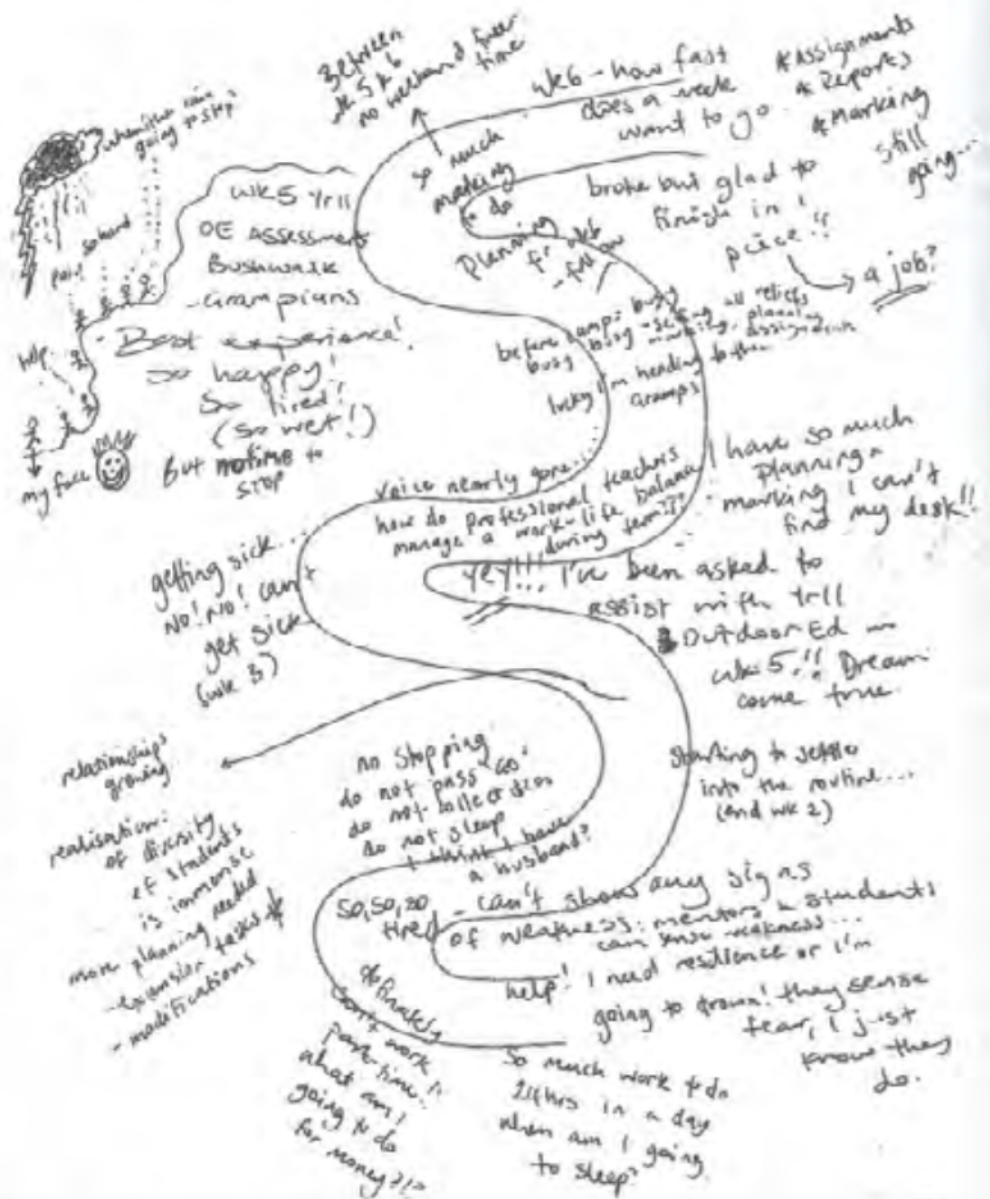
Figure 6.1 Example River Journey