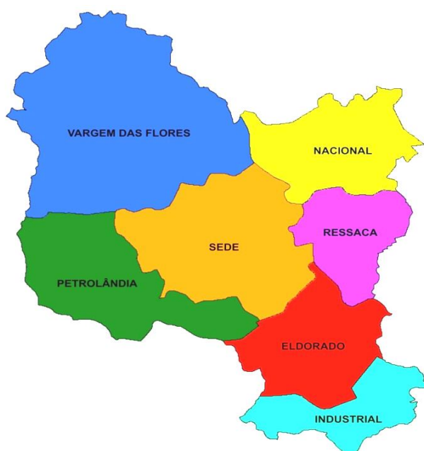
Figura 2: Divisão dos distritos sanitários de Contagem