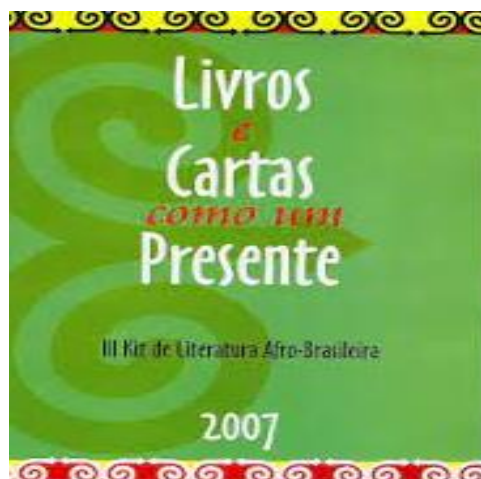
Figura 1 – Livros e cartas como presentes