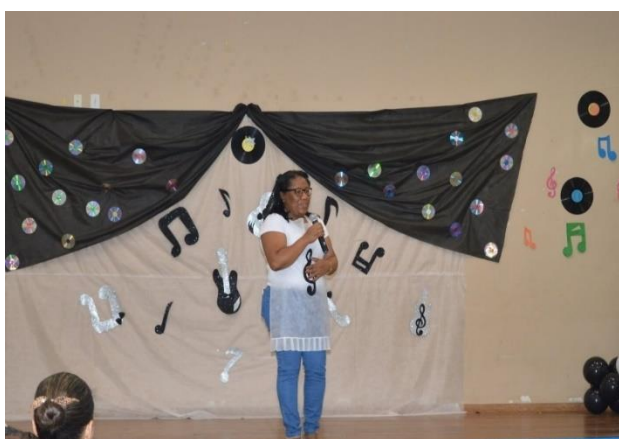
Figura 6 - A diversidade cultural do bairro Alto Vera Cruz