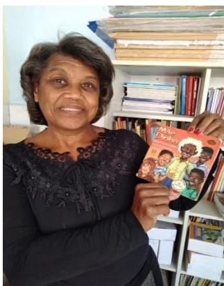
Figura 7 - Projeto promovendo a Igualdade Racial