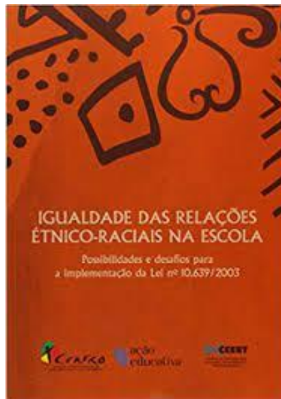
Figura 2 - Igualdade das relações Étnico-raciais na escola