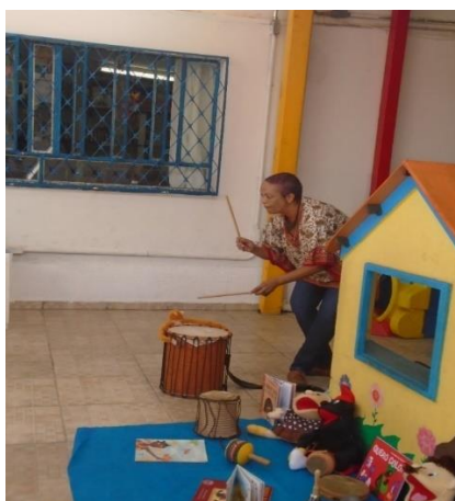
Figura 5 - Projeto Histórias ao som do tambor