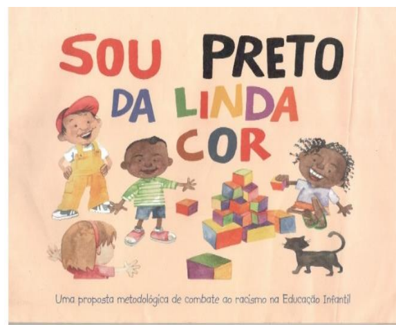
Figura 3 - Sou Preto da Linda cor