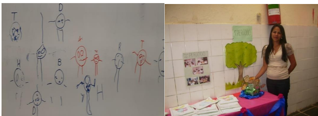
Figura 8 - Projeto a cor da vida