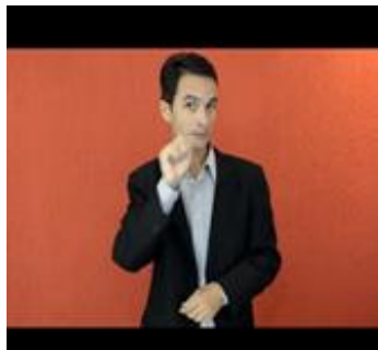
(a) Narrador explicando a história