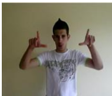
(a) Direcionamento do olhar do narrador para a câmera