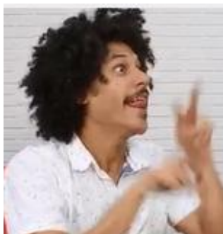
(a) Olhar para dentro da cena