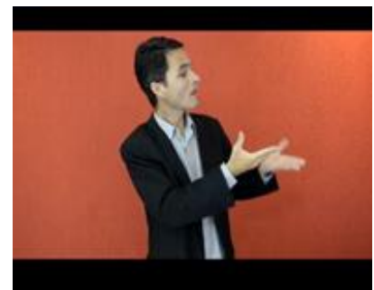
(c) Incorporação de Jesus conversando com a mulher