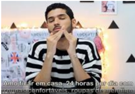
(a) Incorporação do personagem na narrativa