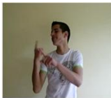
(b) Direcionamento do olhar do narrador observando o personagem (CL, CM “1”)