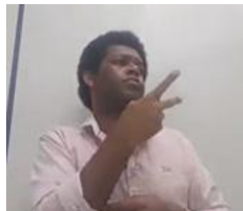
(b) Exemplo sobre Estelionato