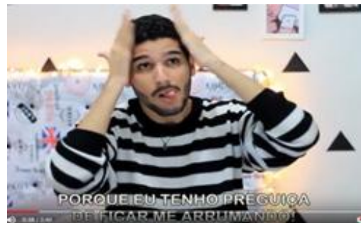
(b) Incorporação de personagem por meio de estereótipo