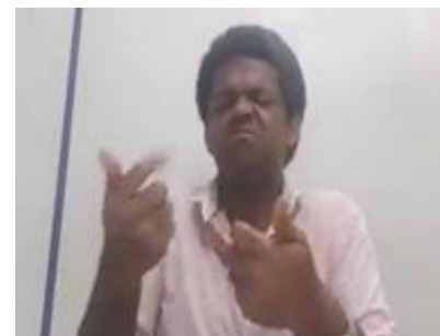
(c) Expressão Facial exaltada de um personagem