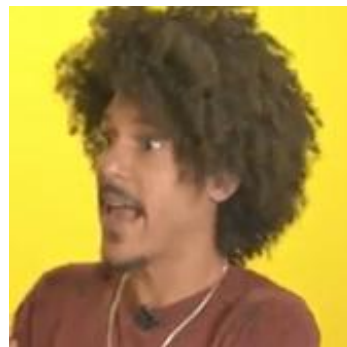
(b) Fala direta do personagem