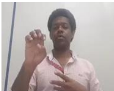
(a) Explicação sobre o Código Penal