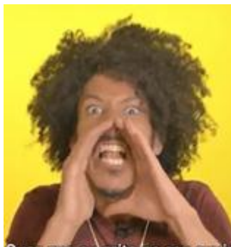
(a) Ação de gritar