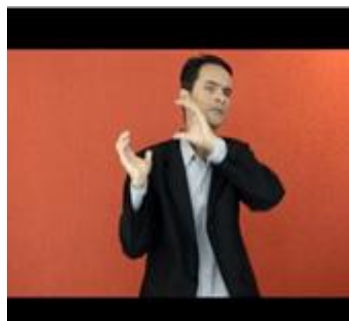
(b) Incorporação da mulher samaritana carregando um vaso ao ombro