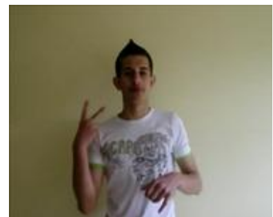
(c) Sinalização do personagem que será incorporado na cena seguinte (PILOTO)