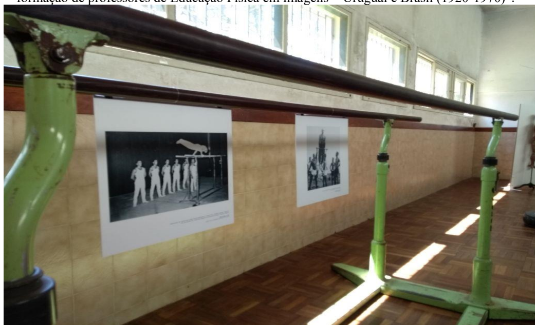
Figura 1: Aparelho ginástico utilizado como suporte expográfico na Mostra Fotográfica “Fragmentos da formação de professores de Educação Física em imagens – Uruguai e Brasil (1920-1970)”.

Outro aspecto fundamental das exposições é reconhecer que para além do acervo selecionado há que se construir um diálogo com o espaço que abrigará essa narrativa. Na sede o ISEF/Udelar, em Parque Batlle, uma sala de aula foi escolhida - a sala de espelhos - respeitando sua materialidade, marcas do uso e do tempo. Nesse aspecto, não se busca "anular" a superfície expositiva, mas inseri-la em uma ambiência que expresse e faça parte da narrativa curatorial. Também é fundamental pensar no diálogo com outras tipologias de acervo como, por exemplo, mobiliários, equipamento e instrumentos. Muitas vezes estão representados nas imagens e registros das instituições, mas foram, ao longo do tempo, perdendo sua função de uso e relegados aos depósitos presentes em quase todas as universidades. As exposições chamam atenção para esses objetos que fizeram parte das dinâmicas dessas instituições. Assim sendo, alguns aparelhos como barras paralelas, traves de equilíbrio, cavalos, postes e redes de voleibol, entre outros equipamentos, foram inseridos, dando destaque à sua materialidade e recriando seus usos, transformados em suportes expositivos.