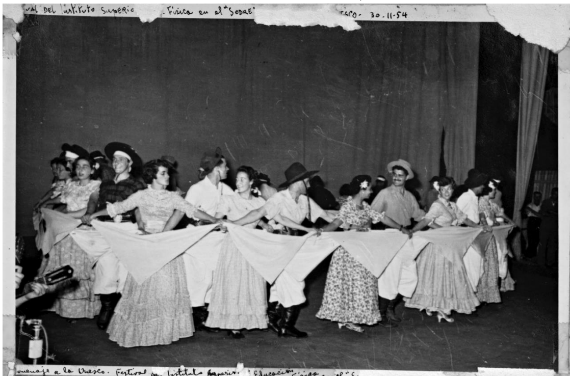
Figura 6: Alumnos Curso Profesores ISEF. Exhibición danza folclórica. 8ª Conferencia de Unesco, Auditorio del Sodre. Montevideo, 1954.