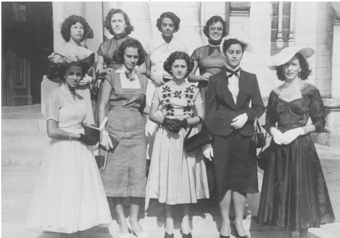
Figura 8: Alunas da 1ª turma do Curso de Educação Física Infantil, no dia da formatura. Belo Horizonte, 1952.