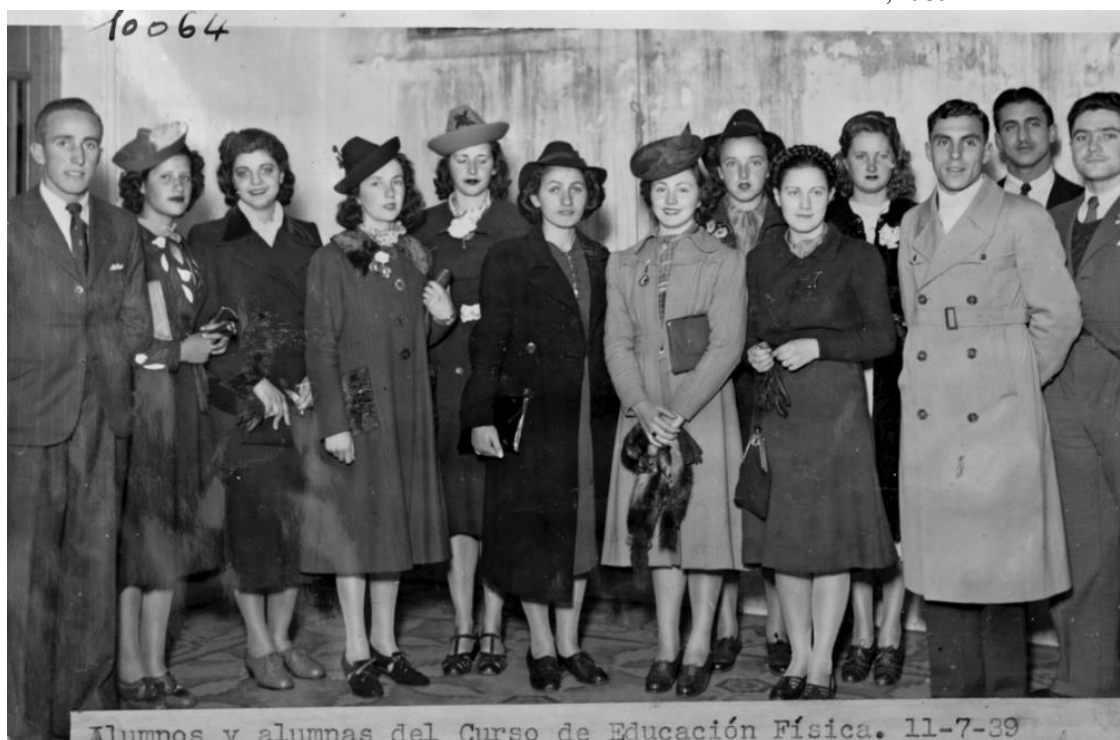
Figura 4: Primeros estudiantes en la Inauguración del Curso para la Preparación de Profesores de Educación Física. Sede Comisión Nacional de Educación Física. Montevideo, 1939.