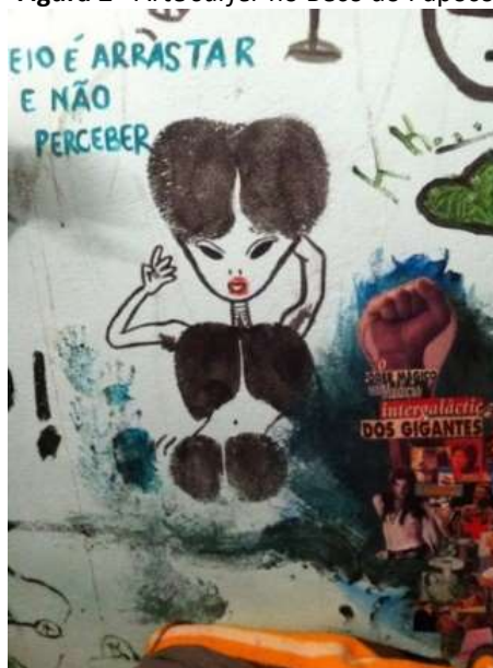
Figura 2 - Arte surfer no Beco do Papoco