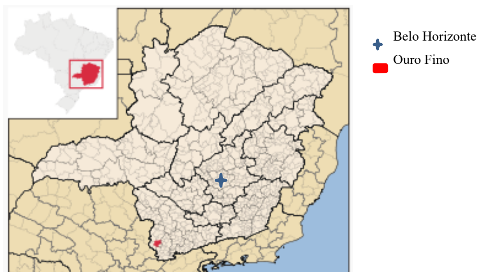
Figura 1 - Localização de Ouro Fino em Minas Gerais