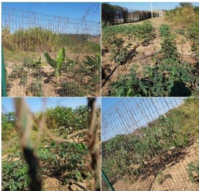
FIGURA 2: Terreno da horta

Após as considerações do Engenheiro Civil e do jardineiro, que atuam no setor de Infraestrutura da UNIFEI, foram selecionados dois possíveis terrenos, que foram repassados à Diretoria Geral do Campus para análise e autorização, assim o espaço foi definido. O terreno disponibilizado está localizado atrás de uma estrutura pré-moldada de salas, anexa ao campus, e tem um tamanho inicial de mil metros quadrados. Uma situação que ajudou a definir o espaço foi aproveitar parte do cercamento já existente, considerando que o recurso para esta proposta é inexistente, gerando a dependência de doações e patrocínios para esta estruturação, especialmente no atual contexto de falta de verbas das universidades federais. Na figura 2 é possível a visualização do espaço de forma mais concreta, sendo as mesmas imagens reais do terreno registradas em setembro de 2019.