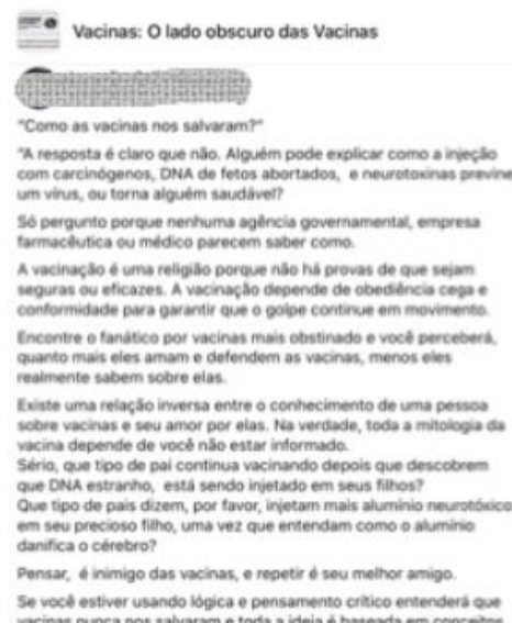
FIGURA 14