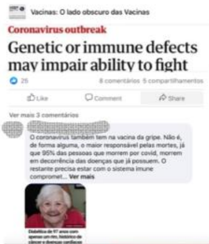
FIGURA 07

A notícia sobre a médica que foi picada por um cobra e diagnosticada com o vírus no hospital é usada falaciosamente também, um reductio ad absurdum , uma vez que se desvia do caminho certo. “Em lógica, a redução ao absurdo consiste no raciocínio, que deriva uma contradição de uma premissa, mostrando que ela é falsa” (Fiorin, 2015, p. 143). Assim, teríamos o seguinte: “Picada de cobra também mata por covid, porque médica picada por cobra, e internada na UTI, foi diagnosticada com covid”.