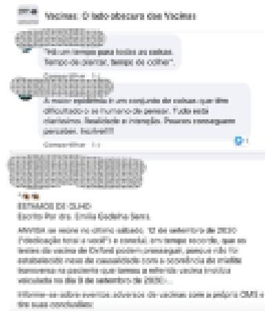
FIGURA 12

Ademais das notícias sobre o covid-19, a página apresenta também notícias e informações sobre outros assuntos relacionados às vacinas e a outras abordagens um pouco mais obscuras, como aquela relacionada ao uso de Viagra por jovens. A postagem incita, por meio de uma pergunta retórica, a dúvida sobre uma suposta relação entre a vacinação infantil e o uso de medicamentos para disfunção erétil pela população jovem.