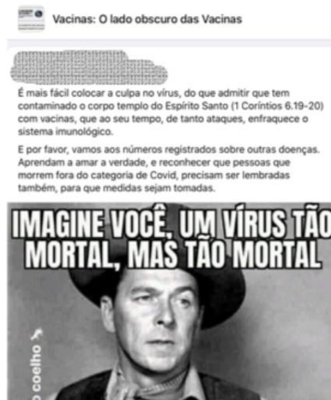
FIGURA 17

O negacionismo da voz da ciência sobre covid-19 no Brasil é, na verdade, a negação da educação, a negação do valor da educação. A partir dessa breve reflexão, notamos que o negacionismo cria um processo de vitimização, não por uma incapacidade de responder à altura do agressor por sentir-se fraco, mas por sentir uma superioridade moral. O negacionista é um “cobrador”, ele quer o que lhe foi supostamente tirado.