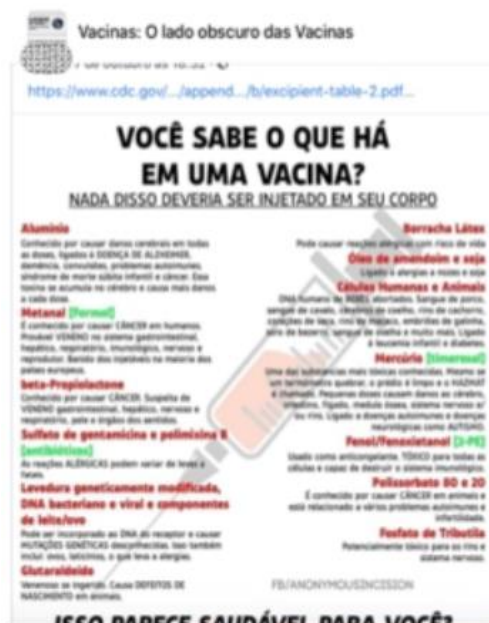
FIGURA 15

A informação de que as vacinas são compostas de DNA de fetos abortados aparece em algumas postagens, assim como a menção aos inúmeros prejuízos causados pela vacina contra o vírus HPV (figuras 15 e 16). São reportagens, notícias de jornais e comentários que, mais uma vez, parecem maquiagem um projeto conservador, preconceituoso e separatista em andamento, o qual também se apoia no discurso religioso. Esse projeto não quer colocar nada em debate, não deseja nem mesmo a erística grega; parece haver nele um desejo de aniquilar o oponente e alimentar o fosso, a separação entre os campos inimigos. Não há desejo de diálogo, de conviver no dissenso, como assinala Amossy (2014). Não há desejo de se conviver na democracia. O projeto se alimenta da divisão social e almeja a erosão da democracia. O movimento é pelo silenciamento do outro, por meio da violência verbal e por meio de fakenews que baralham a percepção do real. Tudo isso sustentado no discurso religioso: