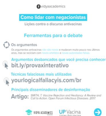
FIGURA 1 Fonte: União Pró-Vacina 10

conter essa onda e evitar que as doenças já erradicadas retornem e promovam o colapso do sistema de saúde no Brasil. Eles apresentam informações por meio de diversos recursos, além de ensinar a lidar com os negacionistas, como se pode observar no site e nas figuras 1 e 2 a seguir.