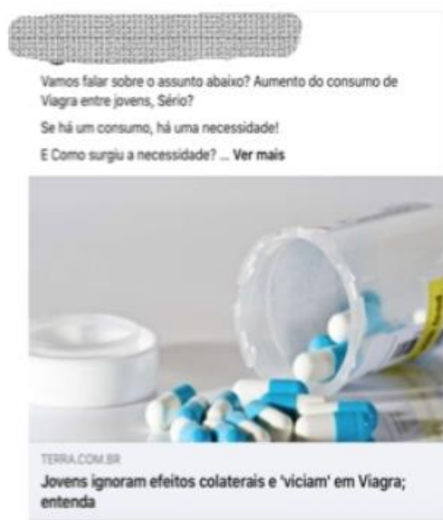
FIGURA 13

Ademais das notícias sobre o covid-19, a página apresenta também notícias e informações sobre outros assuntos relacionados às vacinas e a outras abordagens um pouco mais obscuras, como aquela relacionada ao uso de Viagra por jovens. A postagem incita, por meio de uma pergunta retórica, a dúvida sobre uma suposta relação entre a vacinação infantil e o uso de medicamentos para disfunção erétil pela população jovem.