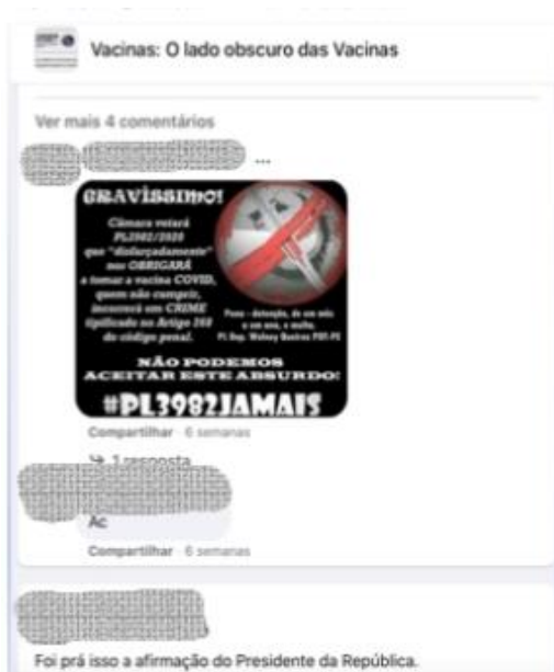
FIGURA 3 Fonte: página facebook 12

social, do uso de máscaras e, agora, de negar a importância da vacinação, negando, dessa maneira, a ciência. Toda essa negativa alinha-se ideologicamente à posição do governo federal, o que se verifica nas seguintes publicações: