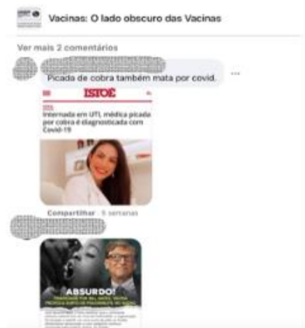
FIGURA 08