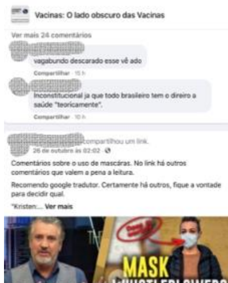
FIGURA 6

Há nas postagens uma escolha deliberada das temáticas – pauta dos costumes (vacina contra HPV, uso de fetos abortados nas vacinas, uso de Viagra por jovens), pauta dos direitos humanos e uso de armas de fogo e munição (privilégios de presidiários), pauta da corrupção (descrédito das instituições: científicas – Instituto Butatã, OMS –, políticas: partidos políticos –, midiáticas: redes de televisão, jornais, revistas), colocadas em jogo. Tudo faz parte de um projeto racional, o que caracteriza o negacionismo. A violência verbal se faz presente por meio de argumentos que incitam o medo, a vergonha. Violentar o outro por meio da linguagem é um meio de silenciá-lo, de fazê-lo calar. Todavia, nas interações, que podem ser acessadas por todos na página, não temos trocas marcadas pela impolidez. A violência fica restrita aos comentários dirigidos a terceiros, como o dirigido a um ex-deputado do PSL, agora em outro partido, o que se notará a seguir. O insulto viola as regras de civilidade, e, em geral, vale-se de um vocabulário ligado à obscenidade, ao escatológico justamente para melhor arranhar a face do agredido.