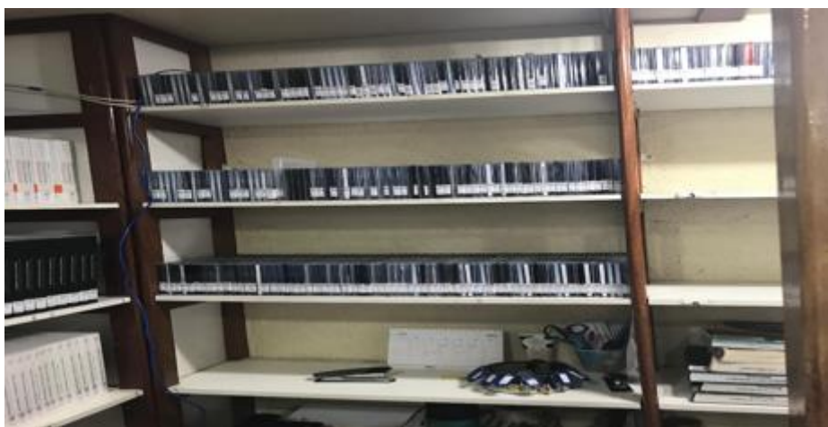
Figura 4 – Multimeios da Biblioteca Dom Antônio Possamai/FCR