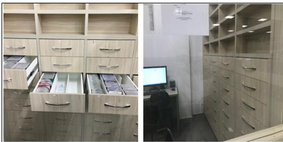
Figura 1 – Multimeios da FIMCA

Em outro armário, conforme apresentado na Figura 1, ainda na sala de multimídia da biblioteca da FIMCA, é possível encontrar os CDs, DVDs, Fitas VHS, entre outros multimeios, que são de rara ou nenhuma procura: