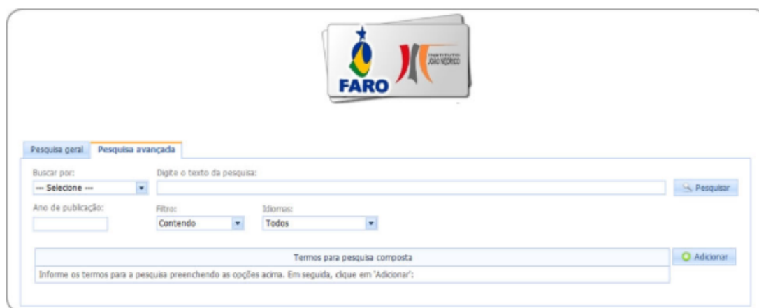
Figura 2 - Catálogo online dos multimeios da FARO

Na Biblioteca da Faculdade FARO, como os materiais de multimeios não estão disponíveis fisicamente, e sim virtualmente, foi possível observar a facilidade de acesso a esses materiais, na casa dos usuários, trabalho e outros, bastando acessar internet e consultar o catálogo online , como pode ser visto na Figura 2: