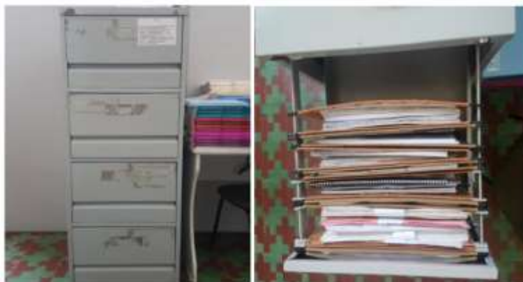
Figura 2 – Arquivo móvel de guarda de documentos da FCR

O armazenamento dos documentos físicos na Biblioteca da FCR ocorre em armário de aço com gavetas para pastas suspensas. Os documentos estão dispostos em pastas em ordem alfabética e por tipo de documento. No interior de cada pasta, eles são organizados em ordem cronológica.