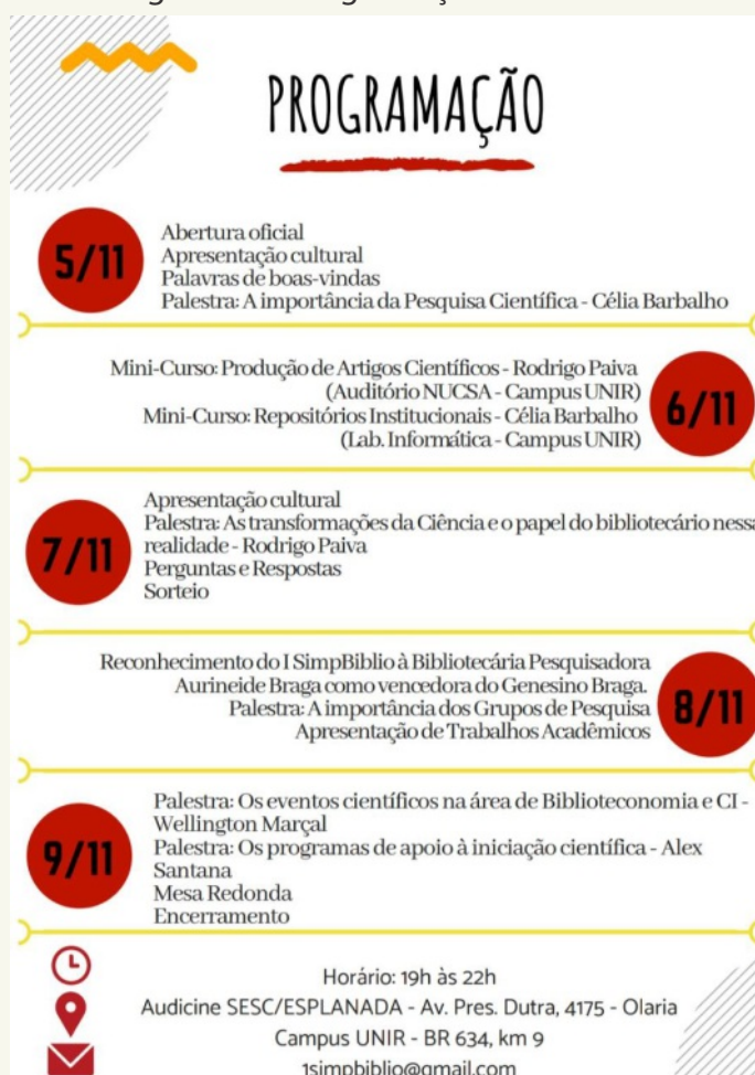
Figura 02 – Programação do Evento

21h45 – Agradecimentos/ Encerramento/Foto Lembrança/ Coffeebreak