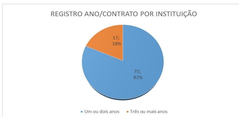
Figura 3: Registro contratação

Observou-se uma grande procura das instituições desde o início do curso, tanto públicas quanto de outras naturezas, com uma diferença de 3% entre elas. Entretanto a descontinuidade de contratação foi muito grande, apenas 17% contrataram por de três anos ou mais anos, o que leva a inferir uma não continuidade no trabalho com arquivos ou a substituição por outros tipos de “mão-de-obra”.