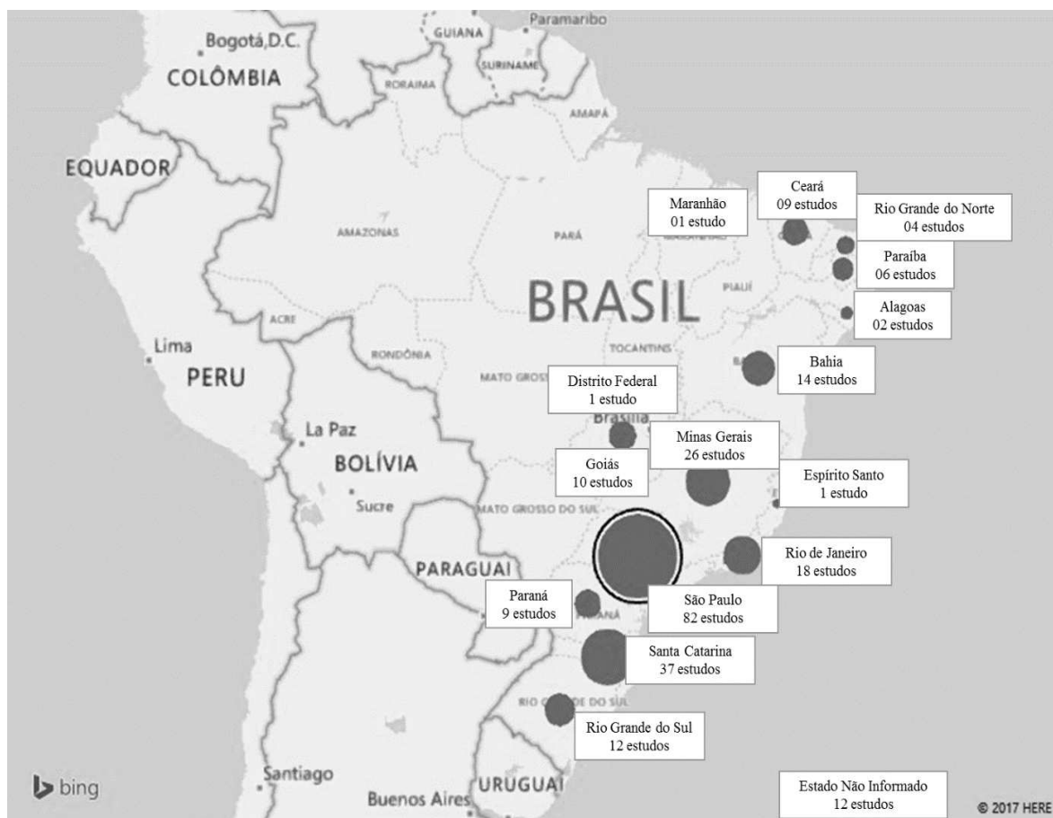
Figura 2 – Quantitativo de estudos por Unidade de Federação brasileira, 2018.

Os objetos de estudo das teses e dissertações estiveram relacionados, principalmente a: cuidados e procedimentos de enfermagem na UTI (46; 18,9%); carga de trabalho, estresse e dimensionamento de pessoal de enfermagem (28; 11,5%); sistematização da assistência e processo de enfermagem na UTI (20; 8,2%); sentimentos e vivência dos familiares de pacientes internados na UTI (19; 7,8%); não informado (15; 6,2%); processo de trabalho da enfermagem na UTI (13; 5,3%); qualidade, cultura e segurança do paciente (13; 5,3%); infecções relacionadas a assistência à saúde (12; 4,9%); saúde do trabalhador, qualidade de vida dos profissionais, riscos ocupacionais e biossegurança (11; 4,5%); lesões por pressão e outras lesões em pacientes internados na UTI (10; 4,1%).