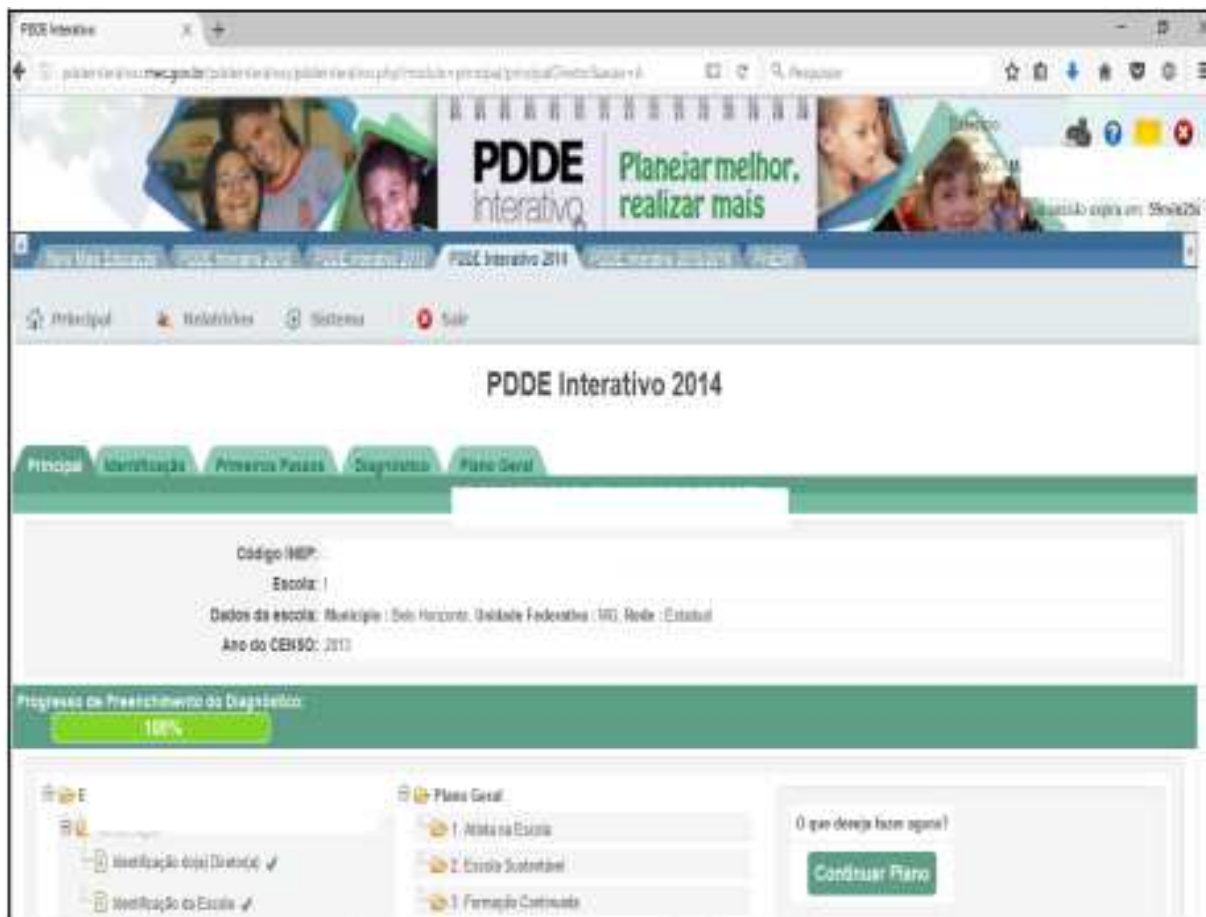
Figura 2 – Estrutura do PDE Escola no sistema PDDE Interativo