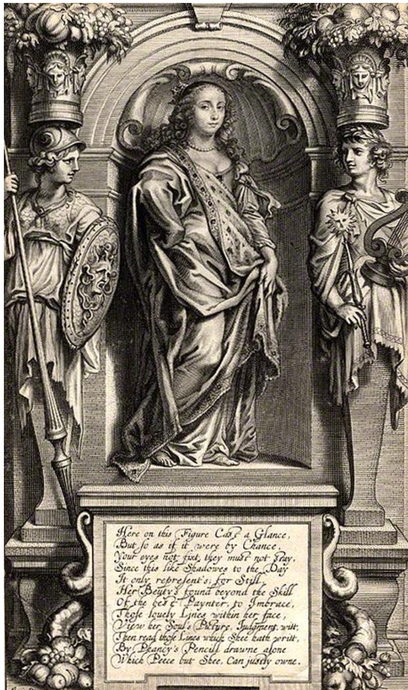
Imagem 1: Retrato de Margaret Cavendish (Minerva e Apolo)