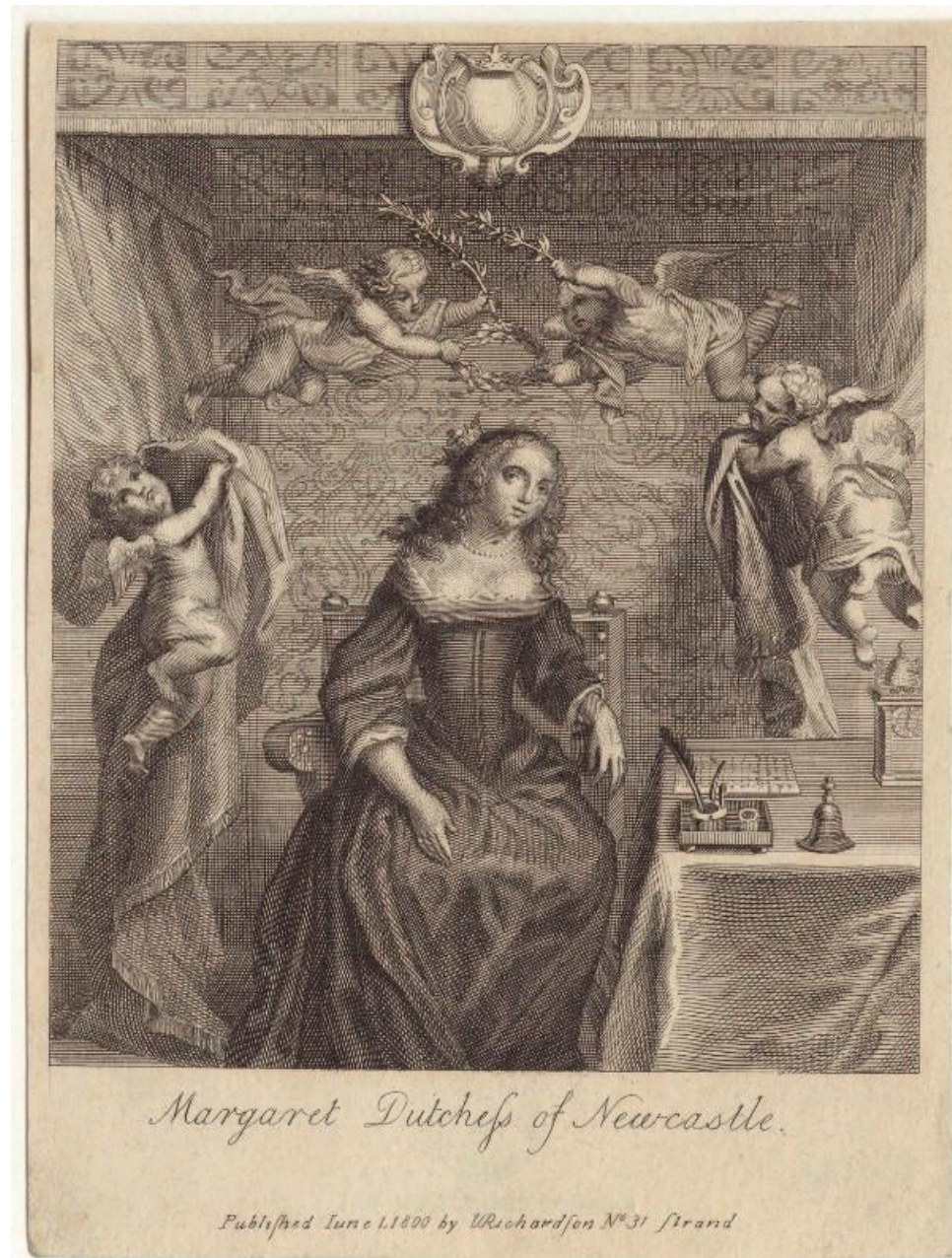
Imagem 2: Retrato de Margaret Cavendish (intelectual com a mesa)