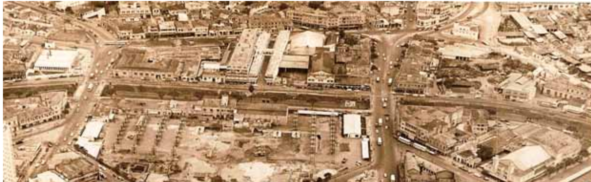
Figura 02. O Bairro Lagoinha com destaque para a Praça Vaz de Melo e a construção do Terminal Rodoviário em 1966.

formado pelos corredores de passagem e pelas desapropriações realizadas ao longo de décadas, mas também o rompimento de laços sociais e o enfraquecimento do patrimônio imaterial do lugar.