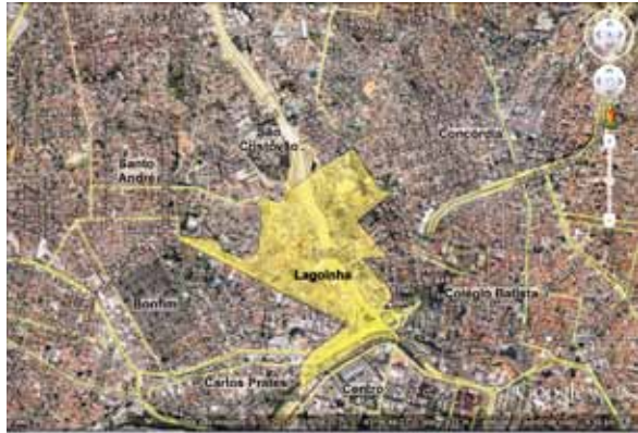
Limite oficial do Bairro Lagoinha

Figura 01. Limites Oficiais do Bairro Lagoinha e bairros vizinhos.