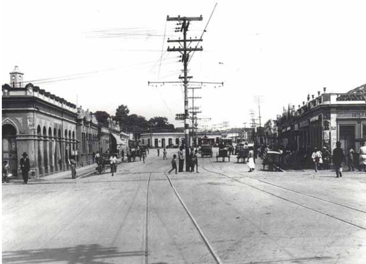
Figura 05. Praça Vaz de Melo em 1930.

2 De acordo com Coelho Netto (1979), o processo de semantização corresponde à atribuição de significação, tanto física quanto subjetiva a um determinado espaço. Quando um espaço sofre o