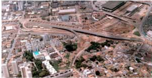
Figura 03. Construção do Complexo Viário da Lagoinha em 1984.