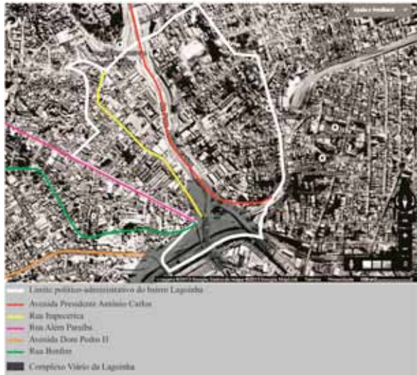
Figura 04. O Bairro Lagoinha nos dias atuais com destaque para os principais acessos da região.

nalizado em 1971, a construção do Terminal Rodoviário na década de 1970, o início da implantação do Complexo Viário da Lagoinha executado na década de 1980 e a consolidação do Trem Metropolitano em 1986 (FREIRE, 2009).