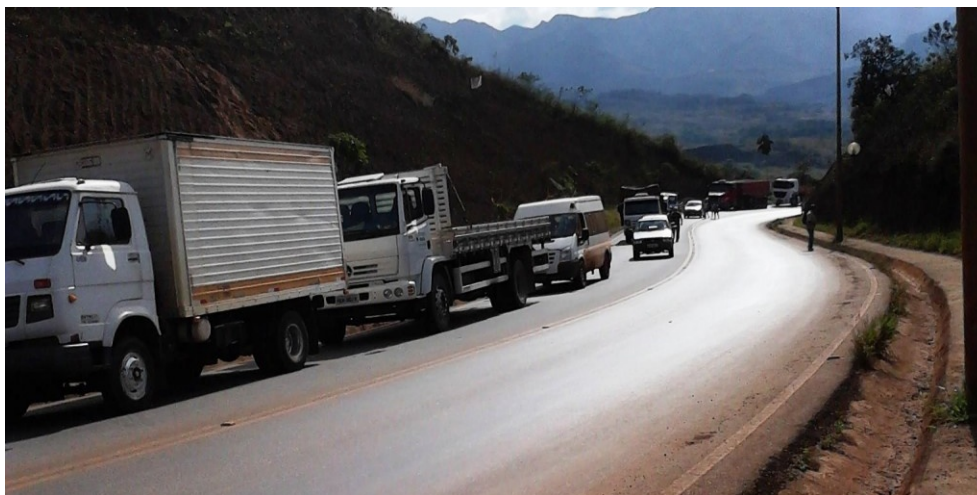
Fig. 02 – Manifestação do dia 21 de junho de 2013.