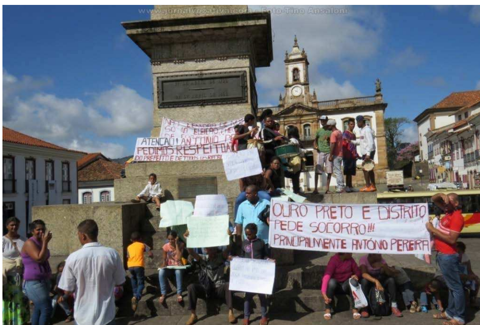
Fig. 03 – Manifestação dos moradores de Antônio Pereira na Praça Tiradentes, dia 30 de abril de 2015.