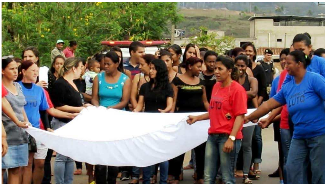
Fig. 05 – Manifestação das mulheres ocorrida em 03 de novembro de 2016.

É extremamente significativo o quanto a autonomia do sujeito político morador do distrito de Antônio Pereira avançou por meio da ação direta. Enquanto se configura como um dos distritos mais abandonado pelo Poder Público, Antônio Pereira, ao contrário das demais áreas precarizadas do município, acompanhou o ciclo aberto das ocupações e das insurreições que despontam nas macro e microsferas do território nacional e se instrumentalizou a partir das manifestações. Vejamos o caminho percorrido pela pesquisa.