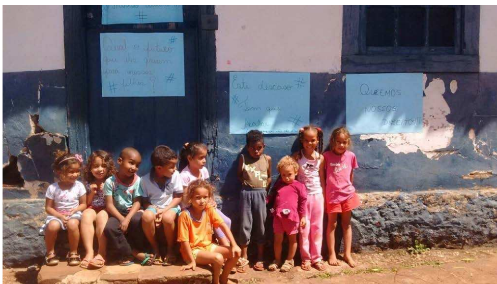
Fig. 04 – Manifestação na porta da Escola Infantil no dia 16 de setembro de 2016.