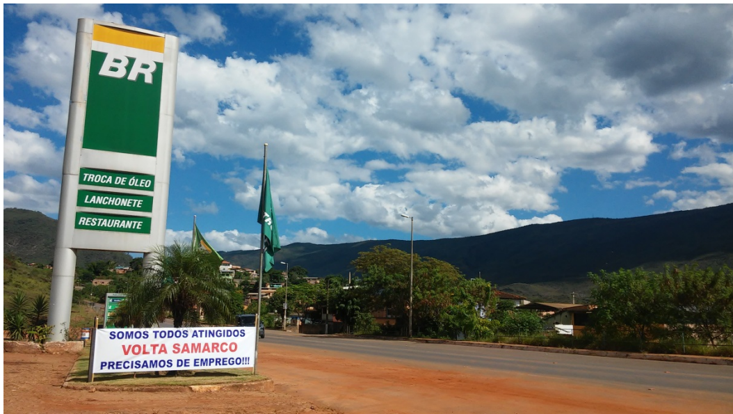
Fig. 07 – Comunidade clama pela volta das atividades da Samarco.

Nesse sentido, é bastante compreensível que o movimento da comunidade seja exatamente oposto ao movimento que as universidades (professores, alunos), que parte dos técnicos, dos movimentos ambientais e dos movimentos sociais organizados vem fazendo no sentido de questionar a exploração mineral e seu modelo insustentável, principalmente em relação às barragens. A indústria de exploração mineral, que se apresenta como uma peça fundamental à engrenagem do capital produtivo brasileiro esconde a sua verdadeira face, pois “a pobreza e a desigualdade das regiões mineradas e sua dependência a IEM [Indústria Extrativa Mineral] se retroalimentam e asseguram a sobrevivência de ambas. De um lado, a pobreza facilita a instalação das atividades extrativas e a aceitação de seus impactos; enquanto, de outro, as operações da IEM dificultam a instalação de outras atividades econômicas, contribuindo para a redução da diversidade da estrutura econômica, sendo a dependência da atividade criada e reforçada por investimentos públicos e privados” (ZONTA e TROCATE, 2016, p. 27).