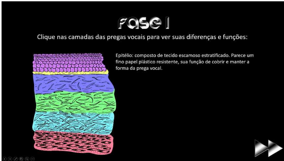
Figura 2. Imagem exemplificada da atividade digital “Histolobby”

O instrumento para coleta de dados que avaliou a usabilidade e a aceitabilidade das atividades digitais foi um questionário on-line autoaplicável, em formato Google Docs , dividido em três blocos. O primeiro bloco constou de informações pessoais (sexo e idade) e participação por período na graduação (separados por aula exclusivamente teórica, ou teórica e prática). O segundo bloco consistiu na versão Portuguesa do System Usability Scale (SUS) 13 , que é composto por 10 afirmações, pontuadas numa escala de tipo Likert que varia entre [1] (“discordo totalmente”) e [5] (“concordo totalmente”). Após a obtenção das respostas, a pontuação do SUS foi calculada subtraindo-se 1 da avaliação dos usuários para as questões ímpares, e subtraindo-se 5 da nota que os usuários atribuíram para as respostas pares; posteriormente, somou-se todos os valores obtidos nas dez perguntas e multiplicou-se por 2,5 para obter a pontuação global, que pode variar de 0 a 100. O ponto de corte situa-se nos 68 pontos, assim, uma pontuação acima desse valor é indicativa de boa usabilidade. O terceiro bloco consistiu da avaliação da aceitabilidade, que foi utilizada como recurso adicional, para avaliar separadamente as duas atividades digitais, compostas por 11 questões fechadas nas quais procurou-se compreender a avaliação dos